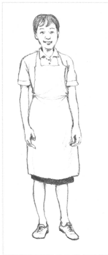
一名按摩师外表应该是这样！

健康职业工作者工作的一部分就是向人们表明，他们没有“个人卫生”问题。要对别人说“靠近你的时候不太愉快”这句话实在难为情；要是无意中听到这样的意见，也会同样地不愉快。还是避免听到这种意见为好！