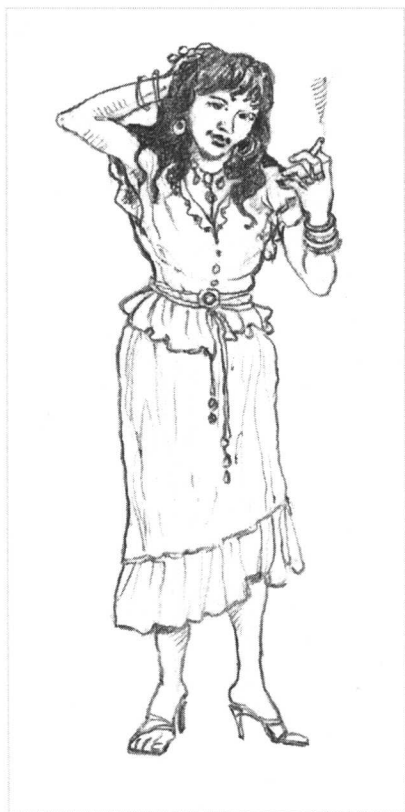
一名按摩师外表不应这样！

个人卫生： 这是至关重要的，尤其是从业者工作的地方与客户离得近的情况更是如此。每天冲一个澡可避免尴尬！应注意呼吸时口气清新，要记住食物、饮料和吸烟都可能对此造成影响。工作日期间要使用漱口水，饭后刷牙，避免咖喱之类具有强烈味道的食物——某些味道留在口腔里的时间比你预计的要长！