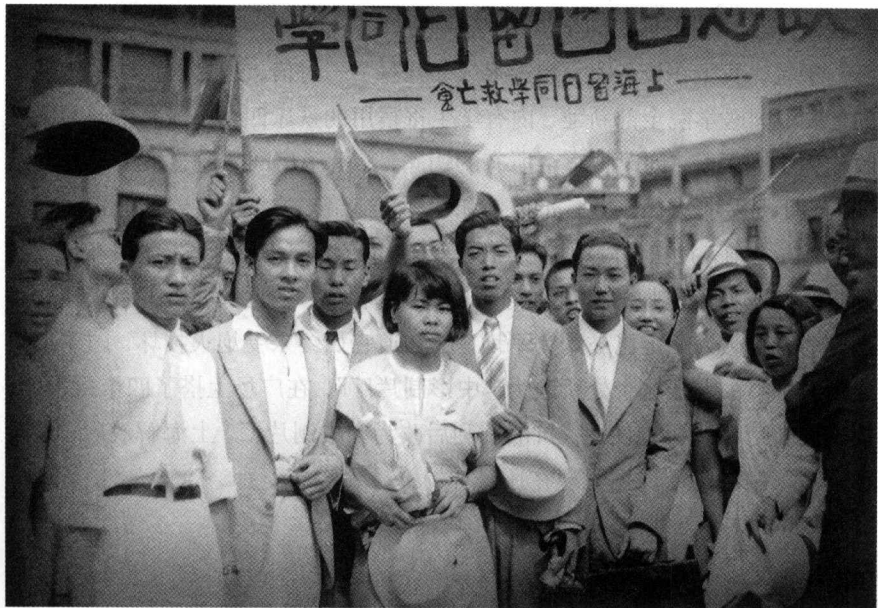
回国抗日的留日学生

是司令部的堡垒攻来攻去攻不下，国军也牺牲不少。另一方面，国军由华界“虹镇”出击，攻打日军心脏部分，先锋部队一直打到虹口汇山码头。日军虽勇，死亡也以千计，这一来，日方就感到军队的实力不够了。