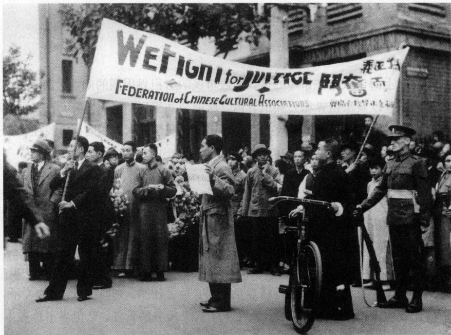
上海文化界的救亡集会

主张要强硬对付，其他出版物如《抗日必胜论》等小册子，销数竟达数万册。表面的情况是如此，而当政的人都知道日本间谍已经渗透了全国上下，等于一个梨子已经从核心里腐烂开来，所以主张“不到最后关头，不作最后牺牲”。在时局最紧张时，国民政府百般委曲求全，如代表国民党的《民国日报》登载了一段提及日本皇室的新闻，日本军部就认为是侮辱元首，要求停版，政府竟然立刻应允。