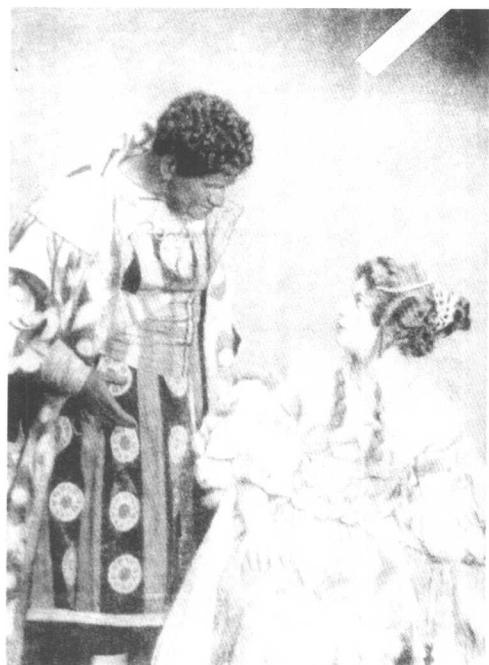
中 《奥赛罗》(莫斯科艺术模范剧院1930年演出)