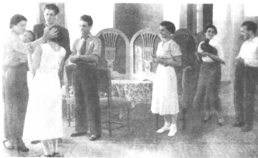
下 歌剧话剧研究所中的作业:《樱桃园》第一幕的排练