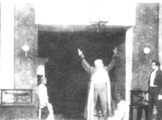
《智慧的痛苦》第四幕 (莫斯科艺术剧院1911年演出)