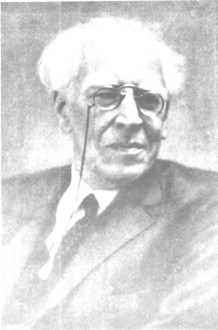
斯坦尼斯拉夫斯基