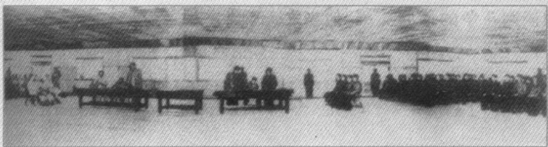
▶ 1953年7月27日，朝鲜停战协定在板门店正式签字。