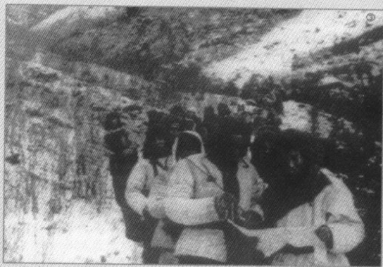
▲ 志愿军第42军先敌抢占黄草岭，赴战岭组织防御，阻止东线敌人的猛烈进攻。