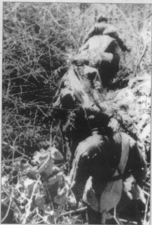
▲ 志愿军第42军攻占宁远后，翻山越岭向“联合国军”侧后迂回。