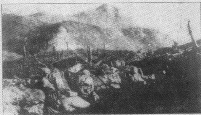
▶ 上甘岭地区在敌人的猛烈炮火下已变成荒山秃岭，而志愿军部队阵地岿然不动。这是志愿军战士凭借坑道工事在阻止敌人进攻。