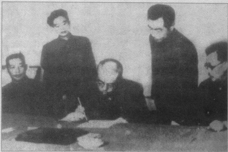
▶ 中国人民志愿军司令员彭德怀在停战协定文本上签字。