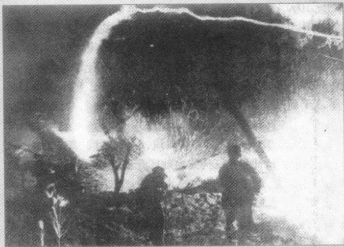
▶ 志愿军战士进行夜间战斗。