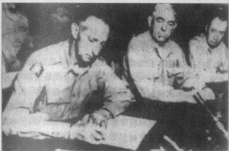
▶ “联合国军”总司令、美国陆军上将马克·克拉克在停战协定文本上签字。