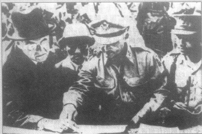
◀ 朝鲜战争爆发前夕，美国总统特使杜勒斯（左）与美军顾问团准将罗伯特（左3）、南朝鲜国防部长申性模（左2）、南朝鲜陆军参谋长丁一权等在“三八线”南侧地区，部署北进作战。