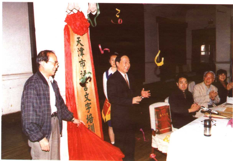
俞海潮副市长为中心揭牌