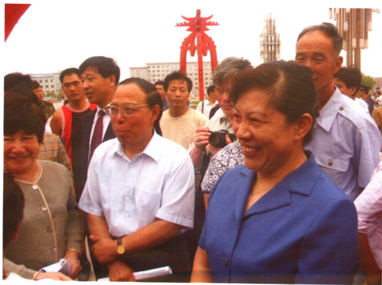
张俊芳副市长参加推普活动