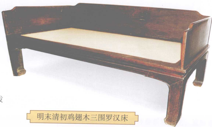
明末清初鸡翅木三围罗汉床

床榻是历史较为悠久的卧具。榻，指只有床身，没有围子和其他装置的卧具，较窄，一般专供休息与待客。榻类家具主要有罗汉榻、贵妃榻。床一般指睡眠用的卧具，常见的床类家具具有拔步床、架子床、罗汉床等。