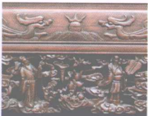
清代红木家具八仙供桌上雕工精湛的花牙板

清代家具的纹饰也多采用植物、动物、风景、人物，晚清的家具纹饰以吉祥纹样“鹿鹤同春”、“年年有余”、“凤穿牡丹”、“早生贵子”、“双龙戏珠”、“五福捧寿”、“龙凤呈祥”等为多见。