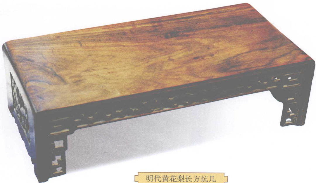
明代黄花梨长方炕几