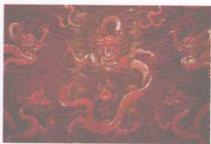
清代剔红雕九龙纹宝座上的云龙纹浮雕

有些吉祥纹样，明代、清代都采用，但形象有一定的差别，在选购、投资、收藏时可以通过细节加以辨别。如明中期的麒麟纹一般是卧姿，麒麟的前后脚均跪倒在地；明晚期至清早期的麒麟纹多为坐姿，前腿伸直，后腿跪卧；清代康熙以后的麒麟纹都采用站姿。