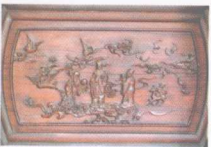
清代红木家具灵芝八仙地屏上的人物浮雕