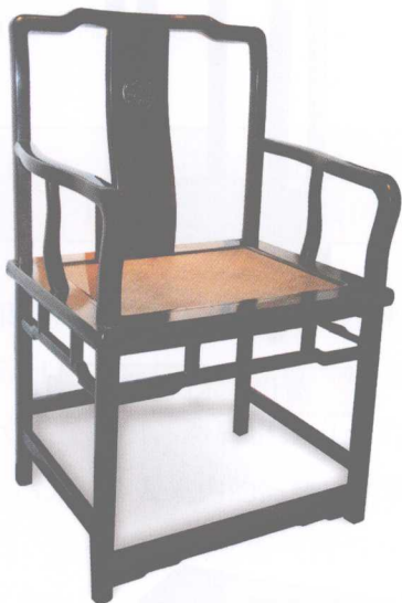
清代紫檀木南官帽椅

椅凳是常用的坐具。椅是一种有靠背和扶手的坐具，凳没有；在形制上，椅比凳小；凳类家具有机凳、方凳、条凳、圆凳等，实用性强而无装饰性；椅类家具常见的有交椅、圈椅、靠背椅、官帽椅、玫瑰椅、扶手椅和太师椅、宝椅、宝坐等。其用料考究，制作精湛，融实用与装饰于一体。