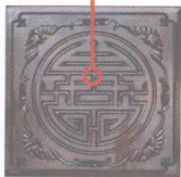
明代黄花梨木小箱上的福寿图