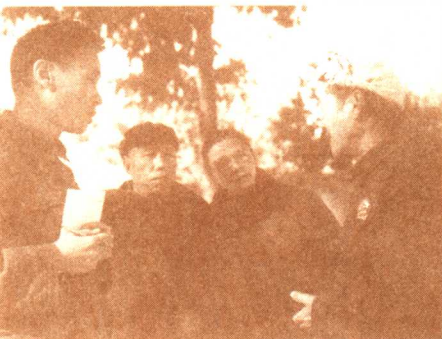
一九七二年，成仿吾在延安与老农交谈。

人按这一估计部署了大量兵力等待我们去自投罗网。又是毛泽东同志在通道县提出了避开敌人的圈套，改向敌人空虚的贵州前进。我们的“左”倾错误执行者这时在惨重失败之后，已经拿不定主意，加上群情十分愤激，只好同意改道贵州。在乘虚直入，夺取贵州第二大城遵义之后，中央在遵义城召开了政治局扩大会议，在会上“左”倾错误执行者受到批判，在广大干部与群众的压力下，会议终于首先在军事上和组织上结束了“左”倾错误的领导，确立了毛泽东同志的领导地位。这时中央红军已经从出发时的八万六千多人减员到约三万人。出发当时就没有宣布前进目标，没有政治工作，红军面临的情况使大家为中国革命的前途十分担心，毛泽东同志重新领导，使军心大振。