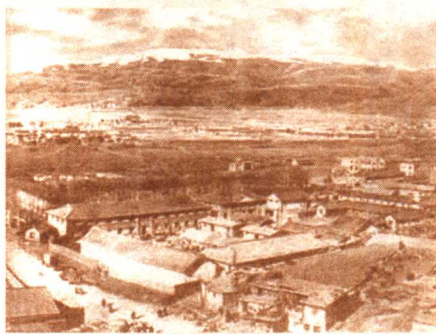
红二、六军团长征出发地——湖南省桑植县刘家坪。

这时,二、六军团由川鄂湘黔边的根据地出发(一九三五年十一月),经过湖南省的新化等县,经贵州、云南、四川数省远征,历尽千辛万苦,也来到甘孜。由于朱德、刘伯承、任弼时、贺龙与关向应等同志坚决维护毛泽东北上抗日的正确路线,再加上四方面军广大指战员也识破了张国焘的错误,也要求北上抗日,因而张国焘的分裂阴谋宣告破产。他被迫取消伪“中央”,重新与二、六军团(已改称红二方面军)北上。这两大主力军经过草地,进入甘肃。当时,中央已派原一方面军主力部队向甘肃西征,接应二、四方面军,一九三六年十月,一、二、四方面军三大主力军终于在会宁大会师,并且很快在山城堡打了胜仗,歼灭了胡宗南的一个师,胜利地结束了伟大的长征,并发展了中国革命的胜利前景。从此以后,我们在毛泽东同志为首的党中央领导之下,实现了抗日民族统一战线,发动