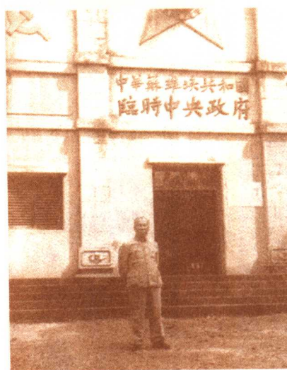
一九二二年五六月间,成仿吾重访苏区瑞金。