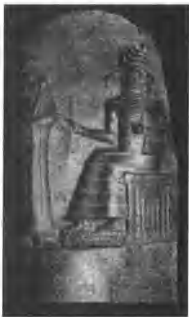
汉谟拉比法典石柱(上半部)

汉谟拉比法典有序文、正文、结语三部分组成。序文和结语宣扬君权神授;正文共282条,内容包括:1、司法审判;2、处理盗窃;3、商业高利贷关系及债务奴隶;4、婚姻家庭及财产继承;5、奴隶买卖及处罚等等。法典规定:拐