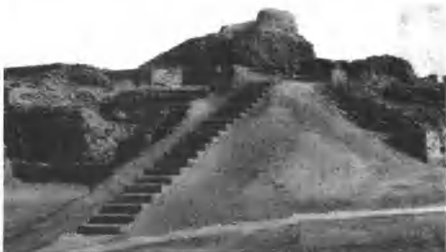
印度河流域古城遗址