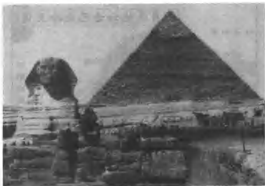
金字塔与狮身人面像