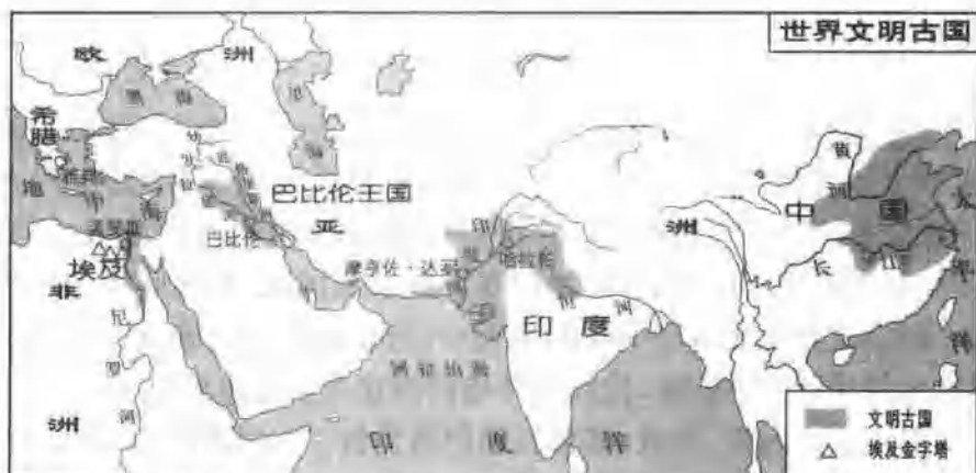
古代亚非文明区域图

五六千年以前,在非洲尼罗河流域的埃及、亚洲两河流域的巴比伦、印度河流域的印度、黄河流域的中国,相继诞生了世界上最早的奴隶制国家,蕴育出人类历史上著名的四大文明古国。