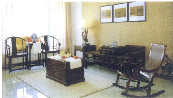
■ 图1-02 以民俗文化为特色的家装效果 *10

家装设计具有较强的时尚性,在很多情况下设计思想是时尚文化的折射。流行是家装设计的一个必然属性,也是我们这个社会的一个重要特征。设计师能不能紧随时代的脚步、紧扣