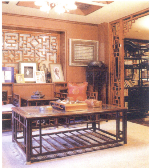
■ 图1-01 充满中国文化韵味的家居 *16

家装设计具有较强的文化性,设计师如果没有较深厚的历史文化修养,在设计构思过程中肯定会缺少许多精彩的想象和创意,因而使自己的设计缺少文化的力量。现在的不少业主本身在这方面就具有较高的素养,这就更需要家装设计师用相当的历史文化修养对设计作品进行精彩的文化演绎。一个有成就的家装设计师对历史文化的理解一定具有自己独到的见解,并能把文脉很好地伸展在自己的作品中,使自己的设计作品成为经典,见图1-01。