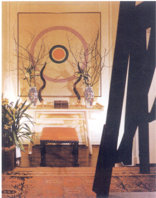
图1-04 用艺术品精心点缀的空间 *27