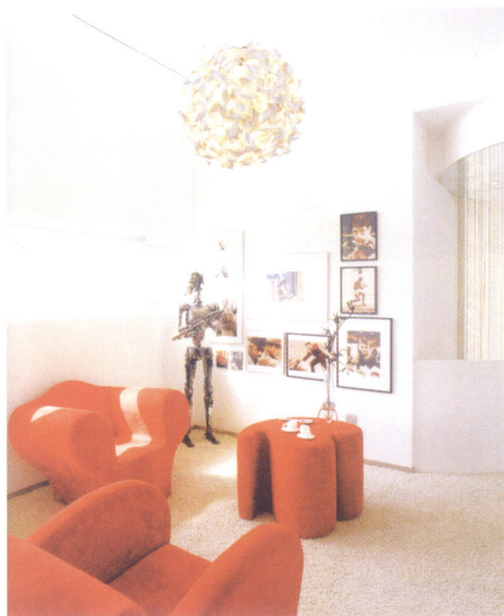
■ 图1-03 时尚色彩鲜明的家装 *8

流行的节拍是设计能否取得成功的一个关键。社会的发展一刻也不会停止,人们思想观念的变化永远不会停息。追求新的东西是人的本能。只是流行的节拍越来越快,需要设计师时刻注意它们的变化,见图1-03。