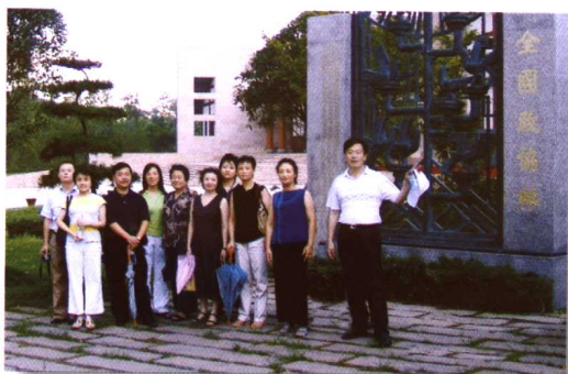
▲小平故里思伟人。本报记者赴广安邓小平故里采访。