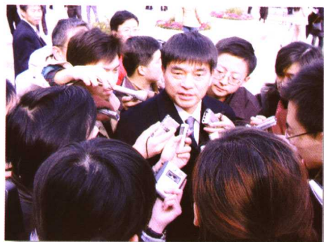
▲新老合力谱华章（组图之一）。 （载于2004年3月4日，获2004年度四川省政协好新闻图片一等奖。）