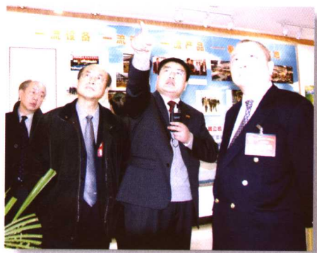
◀港澳委员走进龙泉企业。 （载于2004年2月16日，获2004年度四川省政协好新闻图片三等奖。）