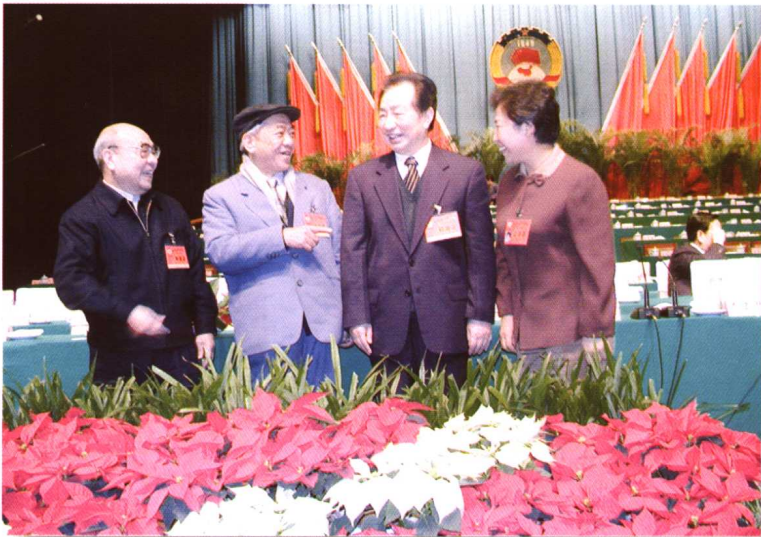
见证过去，展望未来。省政协主席秦玉琴与原省政协主席冯元蔚、廖伯康、聂荣贵在省政协九届二次会议上。