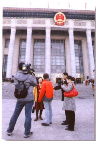
▲每年3月，本报记者赴京采访两会。 （载于2007年1月1日）