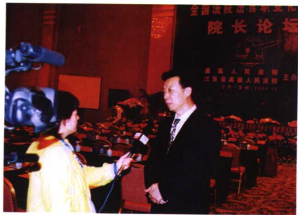
2006年10月，在全国法院法官职业化建设院长论坛上，最高法院政治部副主任宋建朝做了总结性发言，并于会后接受了记者采访。