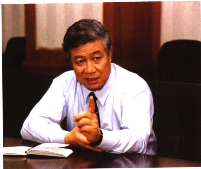
2001年6月，北京市高级法院党组书记、院长秦正安到房山法院专门就法官助理工作进行调研指导。