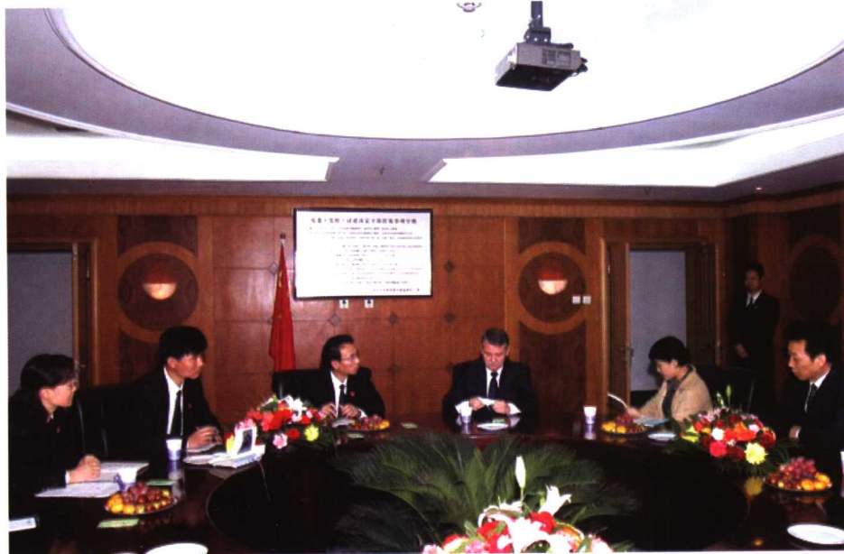
2005年10月，加拿大联邦法院管理局局长雷蒙·圭奈特先生在最高法院政治部副主任宋建朝等有关人员的陪同下到房山法院就法官辅助人员管理问题进行座谈。