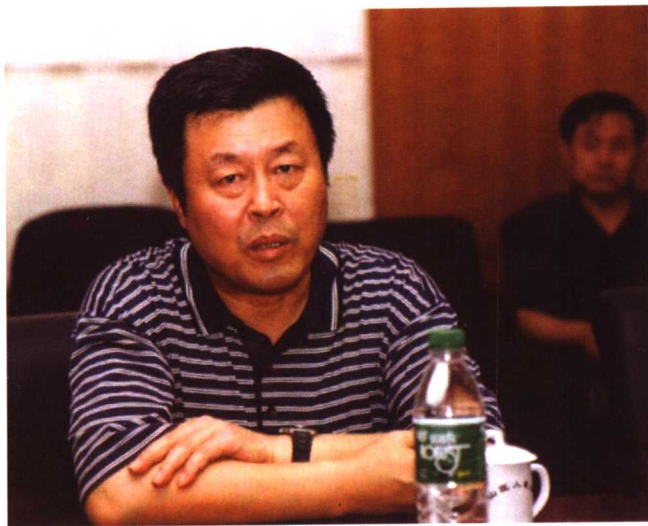
2000年至2001年，时任最高法院研究室主任杨润时就“三二一审判机制”的运行情况先后八次来房山法院调研。