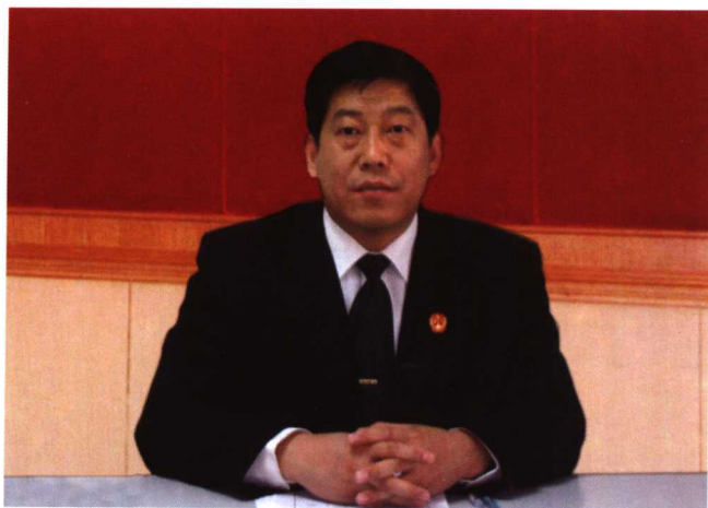
房山法院法官韩朝利获得北京法院第一届“十佳法官”荣誉称号。