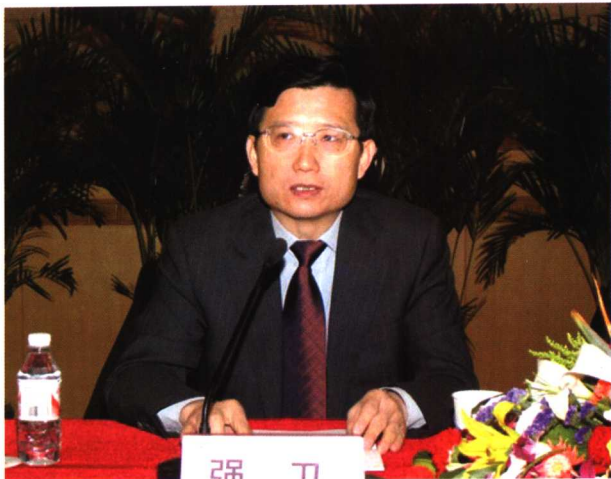
2004年3月，时任北京市委副书记、政法委书记强卫在房山区委号召全区各单位向“全国模范法院”房山法院学习活动动员大会上发表重要讲话。