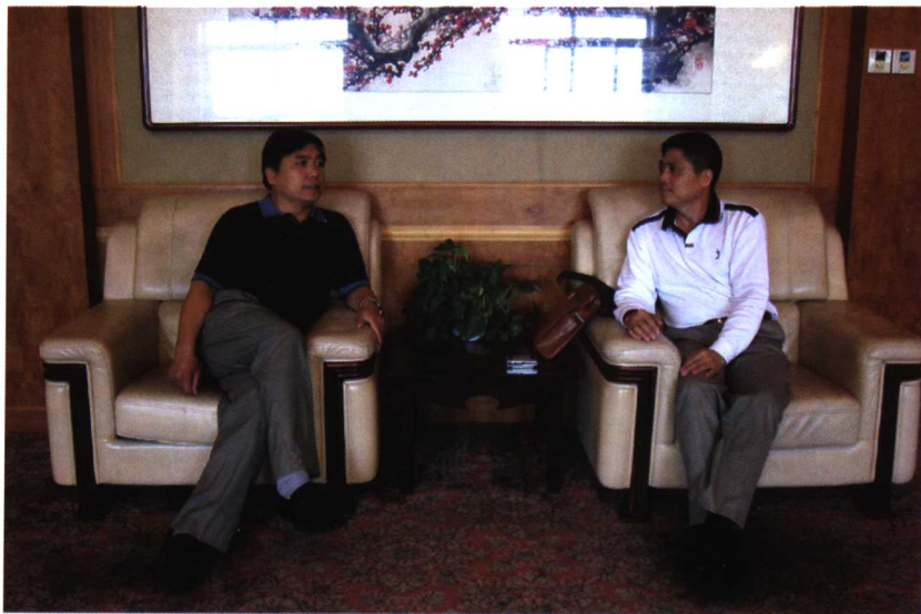
2007年9月，江西省抚州市临川区人民法院党组书记、院长盛明阳一行到房山法院就法官助理制度的运行情况进行考察调研，房山法院党组书记、院长孙国明亲切接见来访的客人。