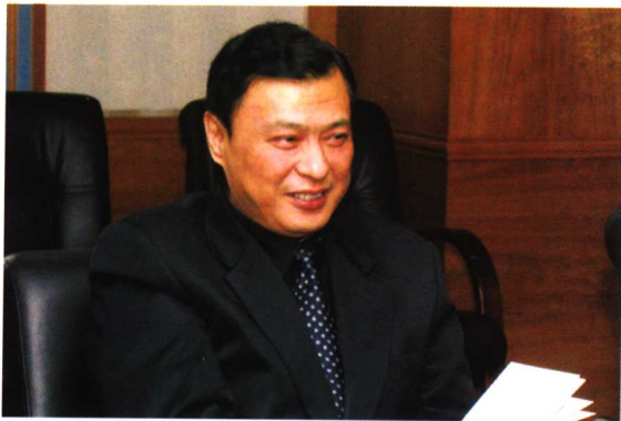
2004年初，时任北京市高级人民法院副院长李克到房山法院调研法官助理制度。