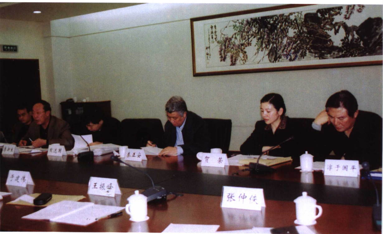
2004年4月，最高法院在北京召开“二五改革纲要研讨会”。