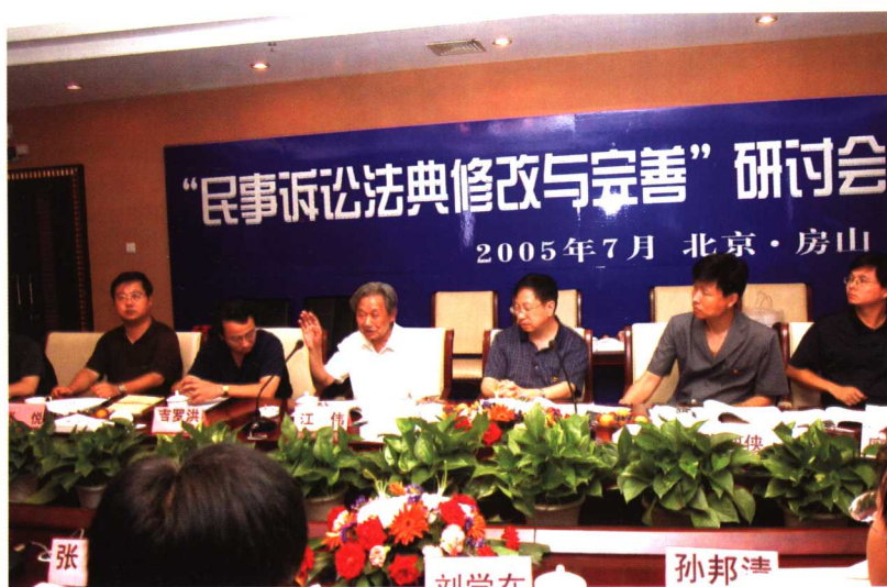
2005年7月，“民事诉讼法典修改与完善”研讨会在房山法院召开。