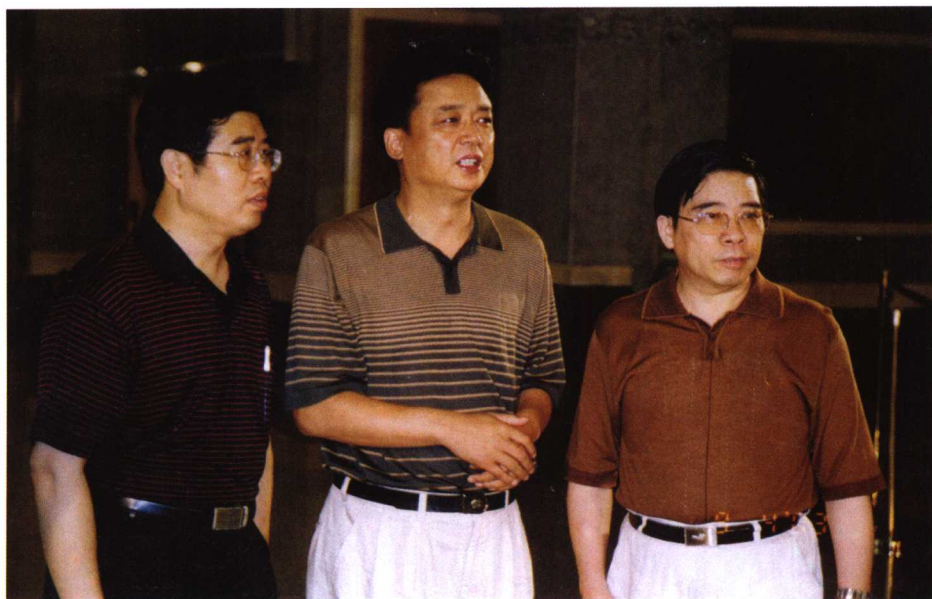
2003年6月，最高法院副院长黄松有、人民法院报社社长王运声到房山法院调研。