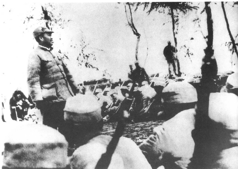
在石家庄战役中，朱德亲临晋察冀军区炮兵旅讲话。