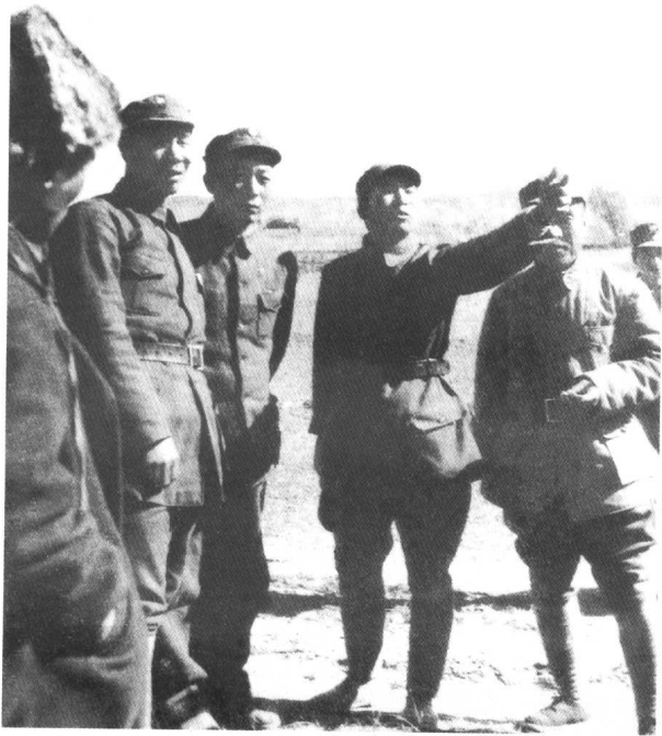
1945年10月，聂荣臻和杨成武在绥远前线指挥作战。