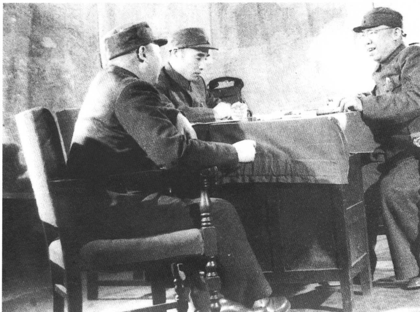
聂荣臻（左）、 罗荣桓（右）和林 彪（中）在平津战 役指挥部研究作 战部署。