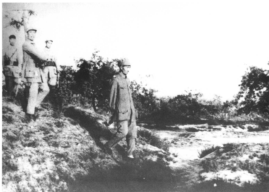
徐向前（前）和周士第（后）在临汾战役前线。