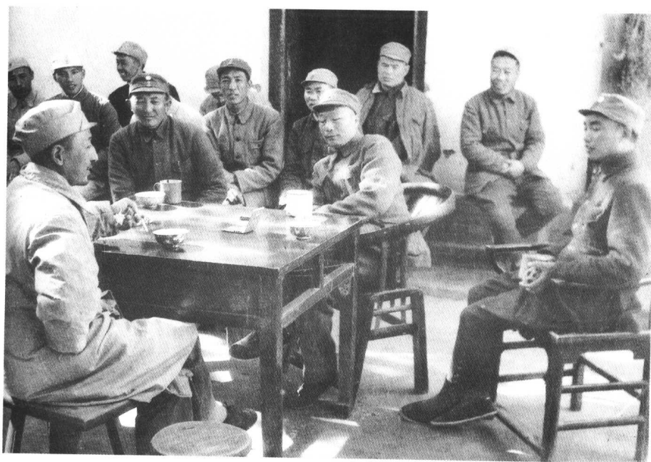
聂荣臻、萧克和杨得志、罗瑞卿接见在清风店战役被俘的国民党第3军军长罗历戎（左）。