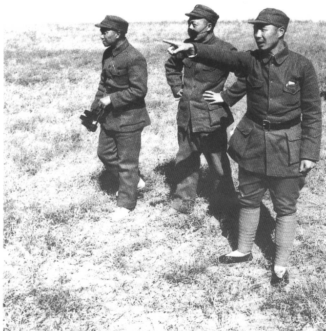
聂荣臻（中）、萧克（左）、杨成武（右）在正太战役前线指挥作战。