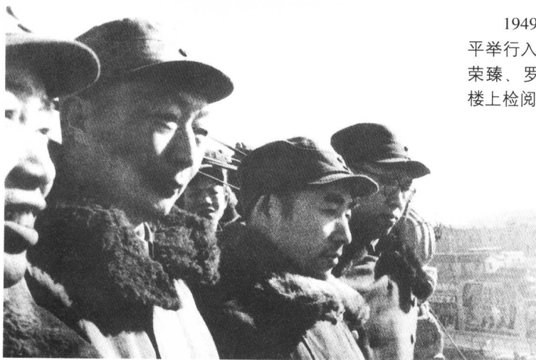
1949年2月3日，北平举行入城式。林彪、聂荣臻、罗荣桓在前门箭楼上检阅我军入城部队。