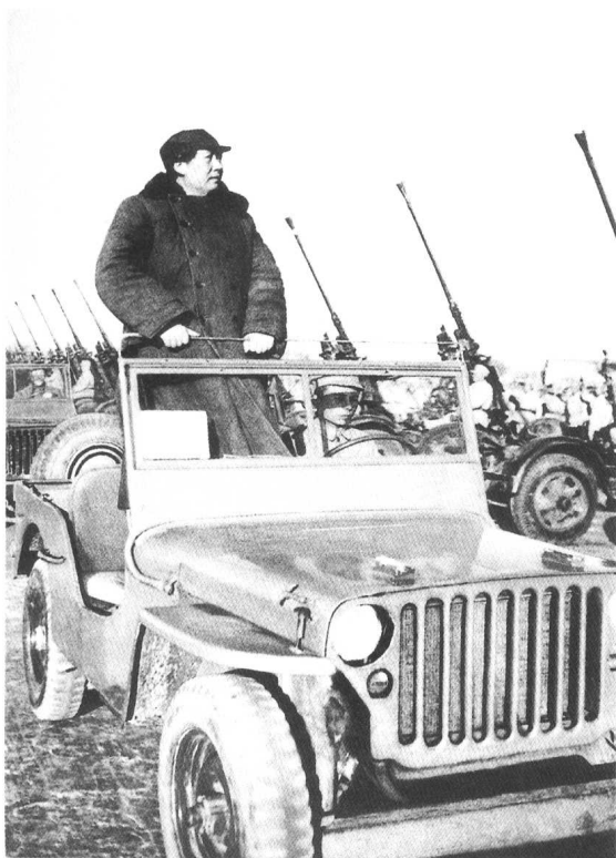
毛泽东在西苑机场检阅高炮部队。