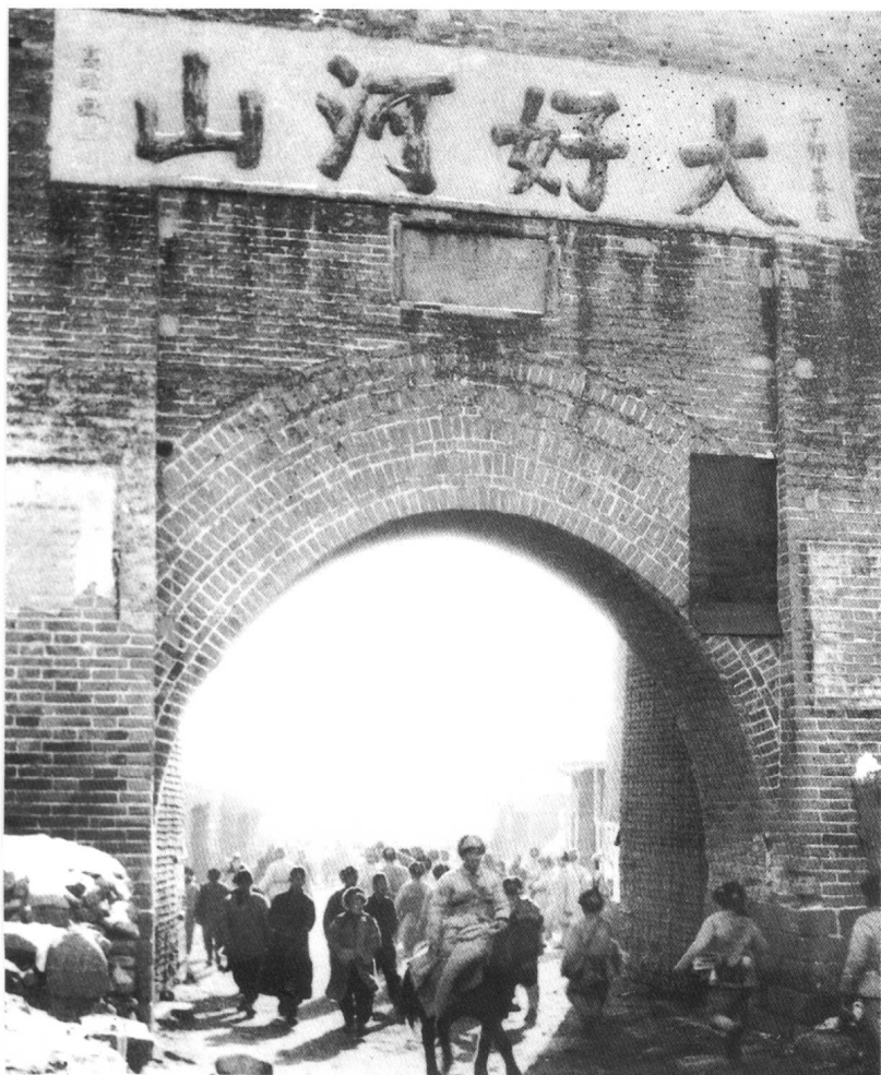
1948年12月24日， 张家口重归人民怀抱。 这是我军进入大境门。