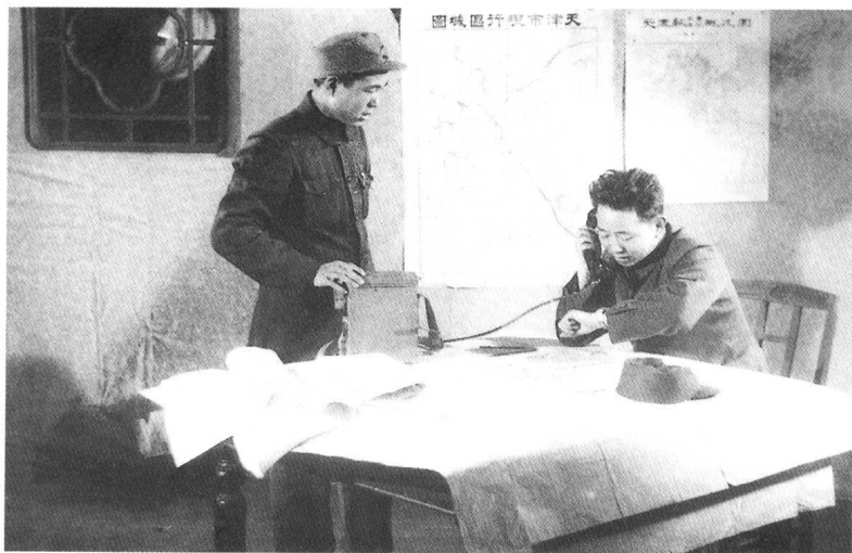
刘亚楼用电话下达总攻天津的命令。