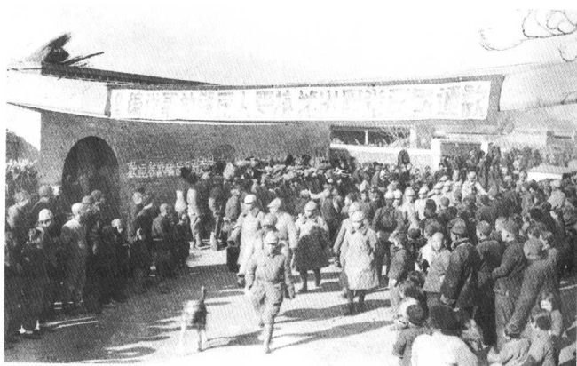
傅作义部队开出北平城外，接受改编。