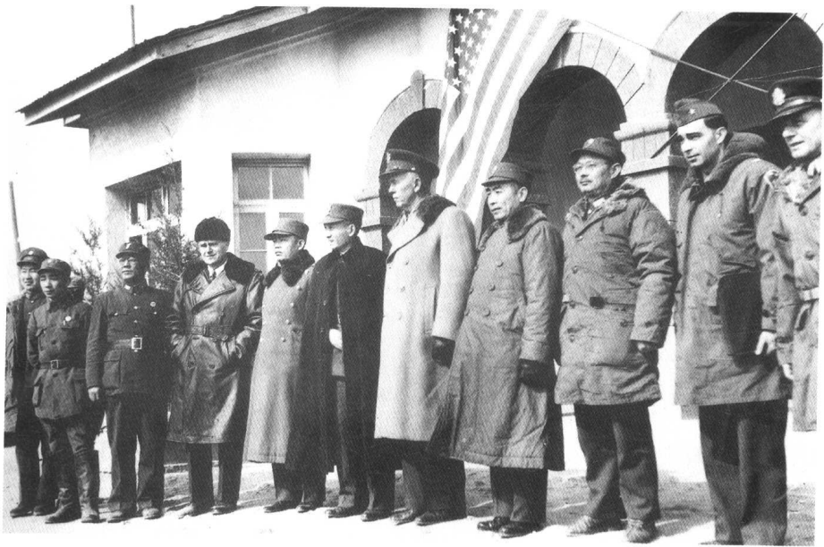
1946年3月1日，军事三人小组到达张家口时，周恩来（右四）、马歇尔（右五）、张治中（右六）、叶剑英（右三）等与随行人员合影。