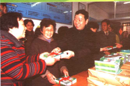
市委常委、副市长周伟强向社区赠送消保维权知识读本

全 面 提 高 苏 州 放 心 食 品 的 上 市 率 商 品 质 量 达 标 率 社 会 维 权 网 络 体 系 覆 盖 率 创 建 先 行 行 业 覆 盖 率 经 营 服 务 业 规 范 率 诚 信 承 诺 企 业 覆 盖 率