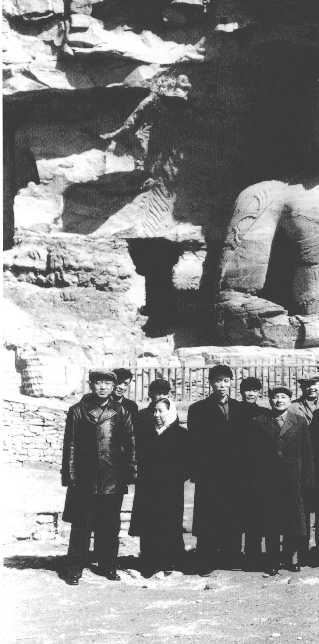
邓小平、彭真一行视察 云冈石窟。