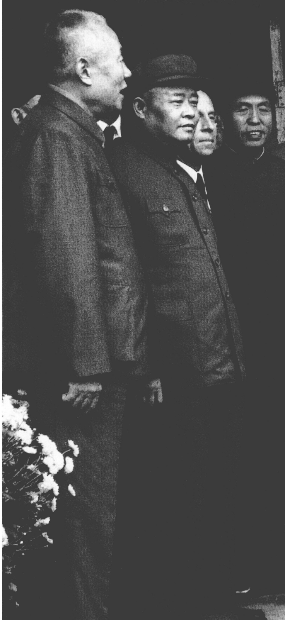
周恩来一行视察 云冈石窟。