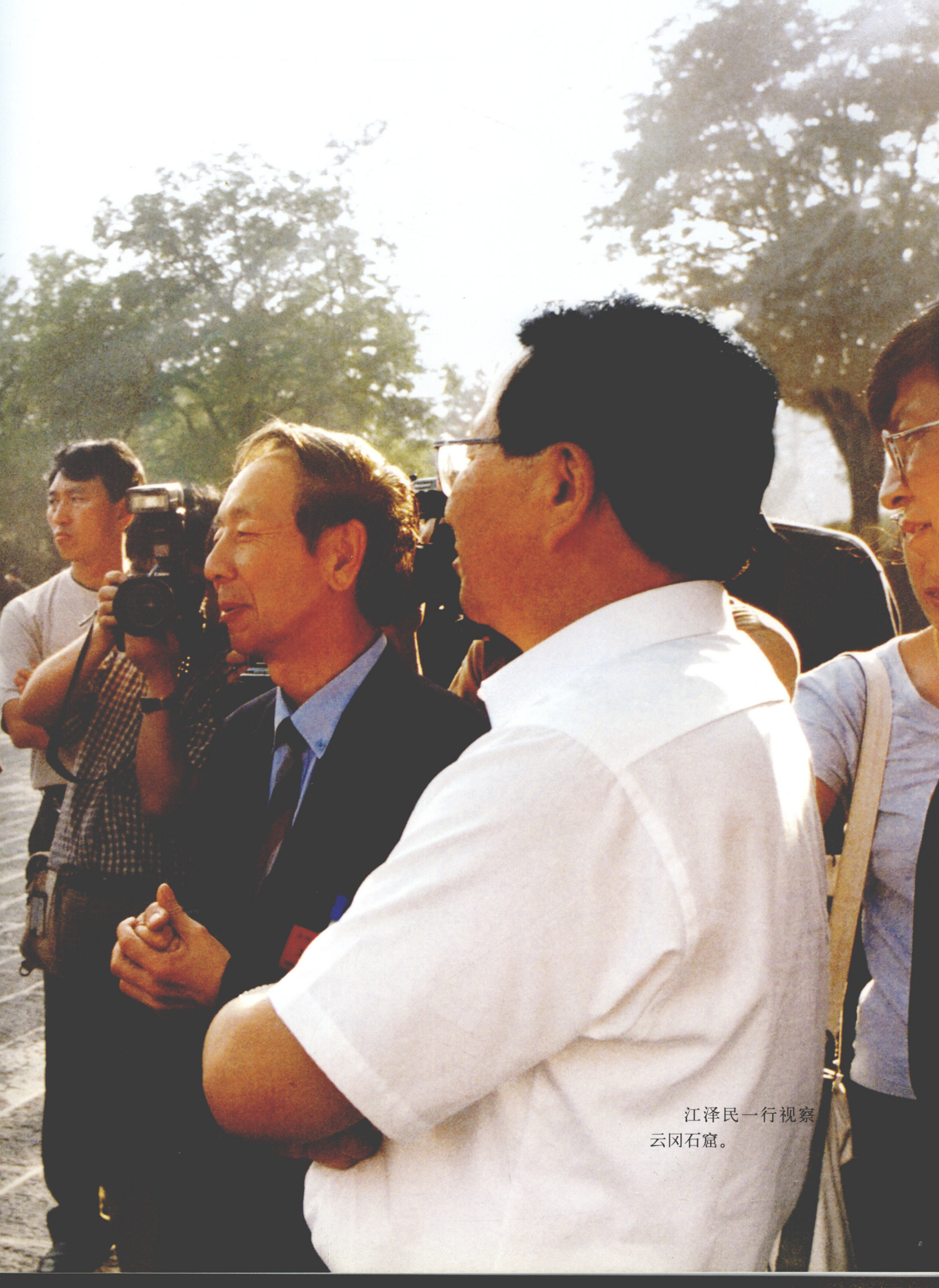
江泽民一行视察 云冈石窟。