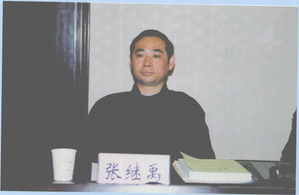
出席第二次评审会的中道协副会长,全国人大常委会张继禹