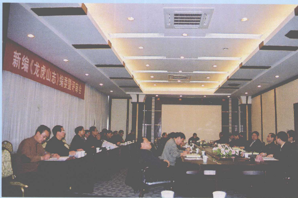
2006年2月14日在鹰潭华侨饭店举行《龙虎山志》第二次评审会