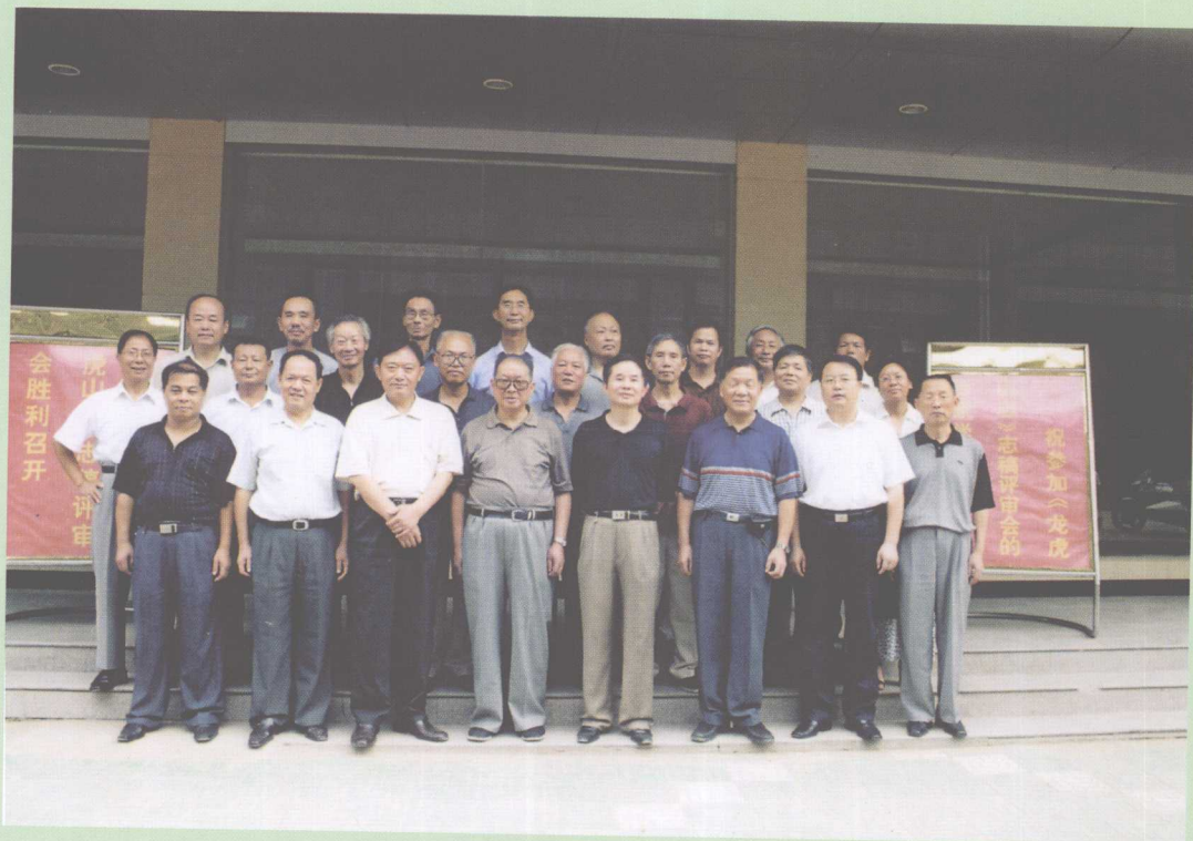
2005年8月28日在鹰潭凤鸣园宾馆召开第一次《龙虎山志》志稿评审会