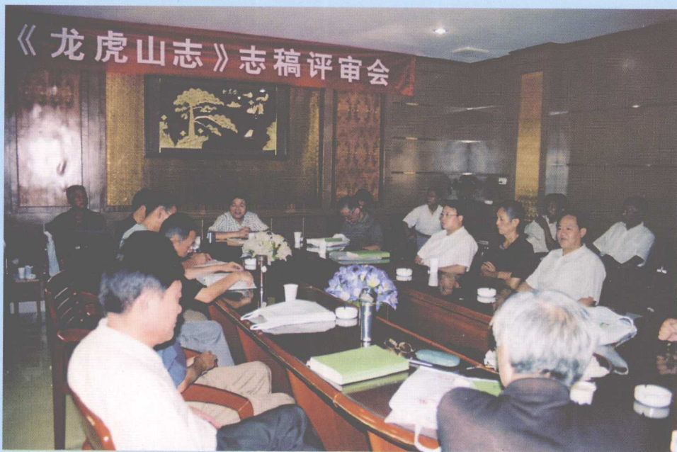
2005年8月18日在凤鸣园酒店召开《龙虎山志》第一次评审会