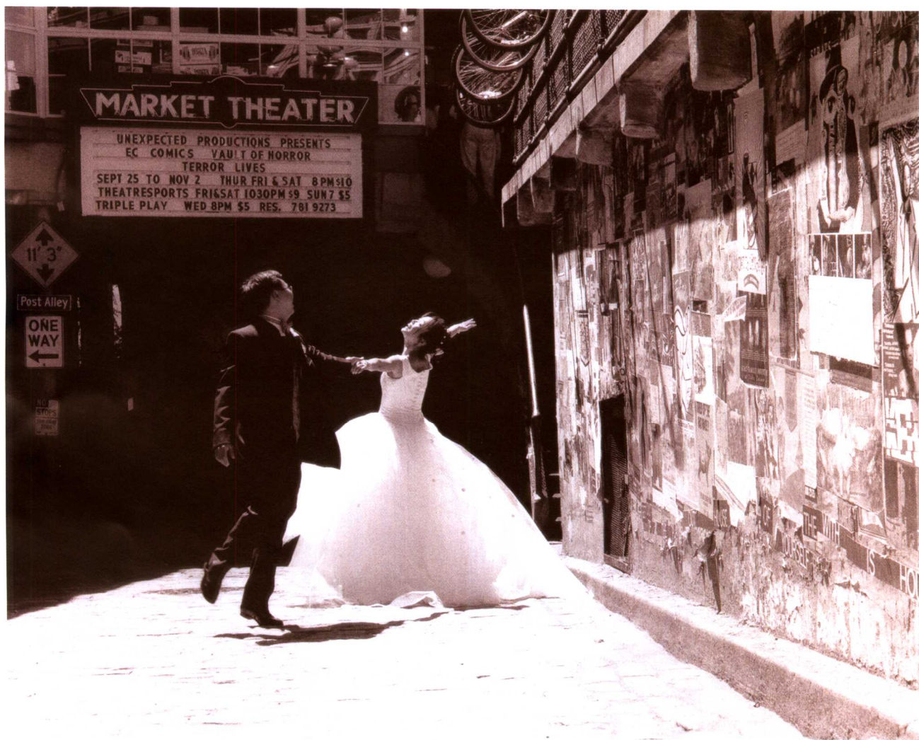
35毫米单反相机是摄影记者最主要的工具，它使用的高速胶卷、镜头、马达驱动以及快门速度为拍摄这样一幅极其自然的人像提供了保证。

但是，你应当避免使用焦距极长的镜头（对35毫米相机来说是300毫米以上的镜头），原因如下：第一，透视会扭曲。由于拍摄距离的原因，人物的面部特征看起来像被压缩了，鼻子