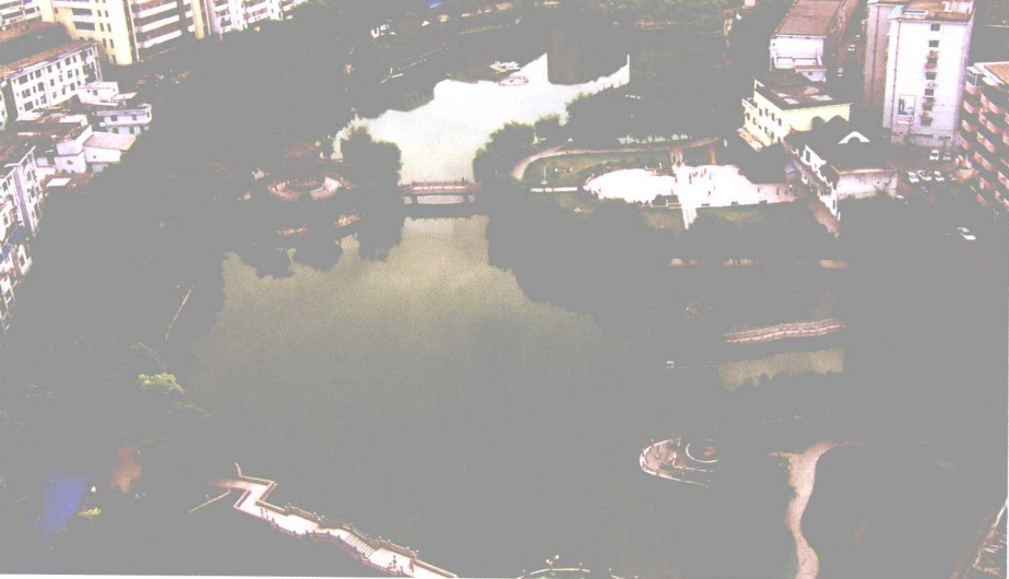
以徐孺子命名的 南昌市孺子亭公园

制。这个时候，中原文化那灿烂的光照对这个刚刚形成的区域还未来得及做深入的渗透，江西的文化蕴含仍处在等待和积蓄当中。直到东汉，江西的文学创作终于有了萌动的讯息。