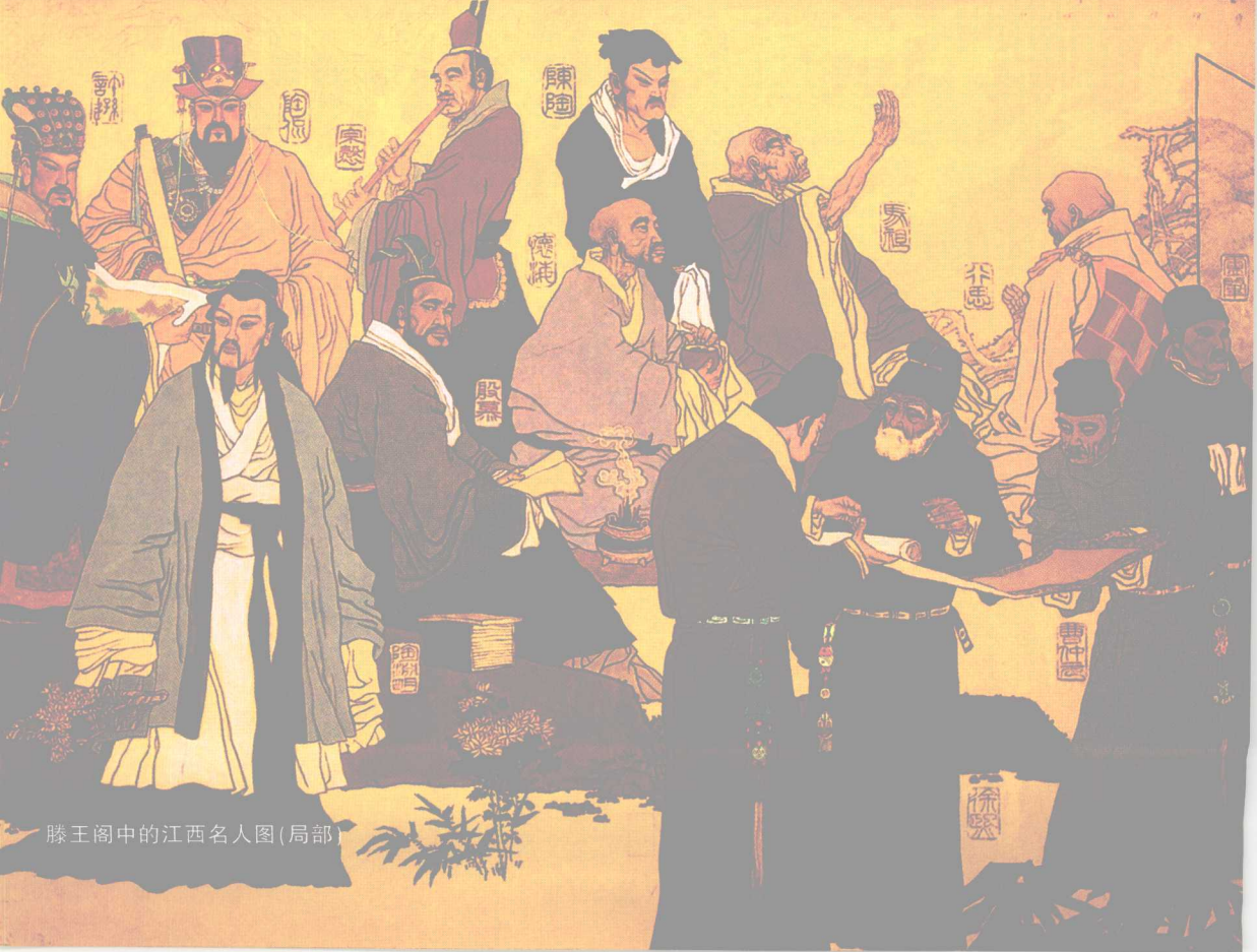
滕王阁中的江西名人图(局部)