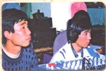
▲ 文山人民广播电台录音员现场录音