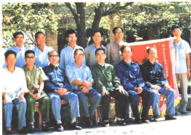
▲ 1985年10月，国家广播电影电视部副部长马庆雄（前排左4）到文山州检查工作。图为与州委、州政府领导合影。州委书记李殿彦（前排左2）、省广播电视厅副厅长徐中高（前排左6）、州长陶文礼（前排左5）、中宣部对外宣传司司长王薇（前排左3）