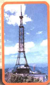
◀ 200米高的电视调频发射铁塔