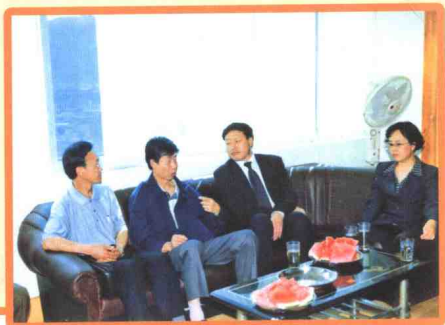
▲ 2005年3月，文山州人民政府州长宋嘉林（左3）陪同云南人民广播电台台长刁承锦（左2）到文山人民广播电台检查指导工作