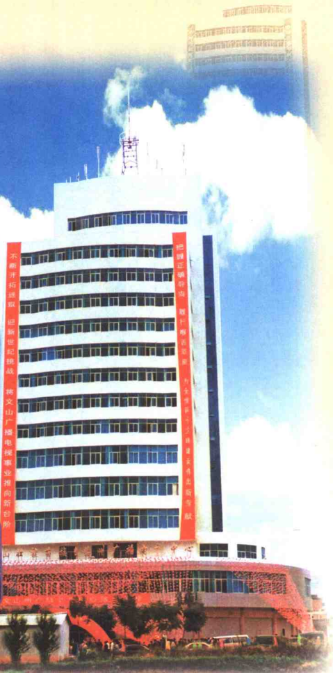
▲ 文山州广播电视中心大楼于 2001 年 9 月 20 日竣工验收投入使用