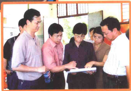
▲ 2005年3月，文山州人民政府副州长孙天竹（右3）到麻栗坡县检查“西新工程”建设情况，州广播电视局局长李建生（左1）陪同