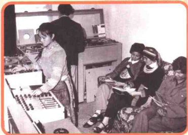
▲ 1979年6月19日，文山人民广播电台台民语组正在制作民语节目