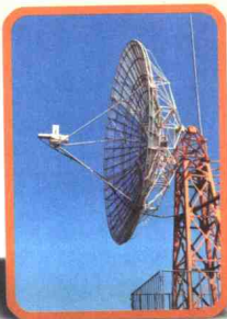
◀ 文山至昆明100千米大跨距微波