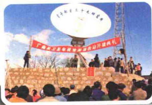
▲ 1986年12月，广南县第一座6米地面卫星接收站在县城建成