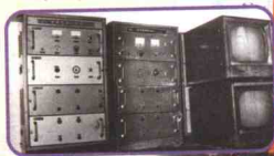
▲ 文山州第一代电视差转机 (电子管 10 瓦) 和黑白电视机