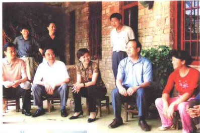
▲ 2005年5月17日， 中共文山州委书记张田欣 （右2），在西畴县委书记张 秀兰、州广播电视局局长李 建生的陪同下深入西畴县董 马乡牛厂坝村，就农村广播 电视的发展进行调研