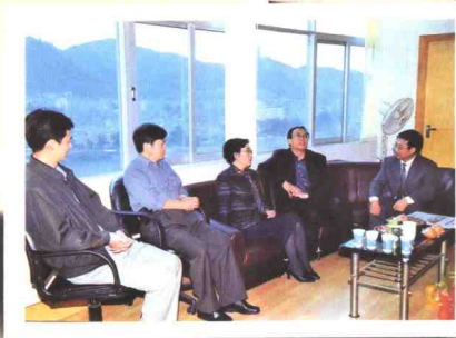
▲ 2005年3月，中共文山州委书记张田欣 （右2）到文山人民广播电台调研