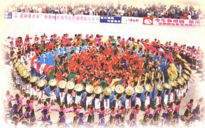
▲ 1993年4月1日，文山州首届国际三七节暨民族节在文山隆重举行，文山人民广播电台、文山电视台进行现场直播