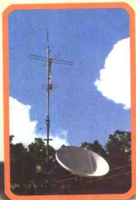
◀ 标准化的「村村通」工程