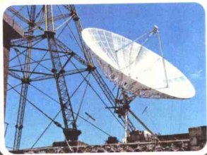
▲ 1985年9月12日，文山州第一座6米地面卫星接收站在文山电视调频骨干转播台建成