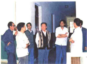
▲ 1987年8月29日，国家广播电影电视部副部长郝平南（中）到文山检查指导工作