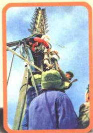
◀ 维修电视高频发射铁塔