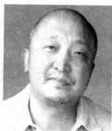
北京作家协会主席 ——刘恒