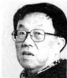
中国作家协会副主席 ——王蒙

“方洲新概念”图书10年来一直得到了全国一些知名作家的指导，拥有顶级的作家顾问团。