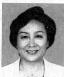
中国家庭教育专家 “知心姐姐” ——卢勤