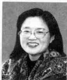
著名儿童文学作家 ——秦文君