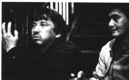
《英雄本色续集》剧照