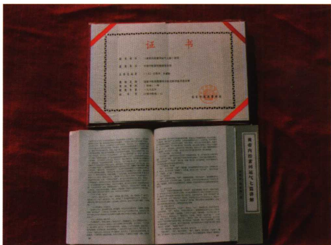
《黄帝内经素问运气七篇研究》获国家中医药局科技进步一等奖