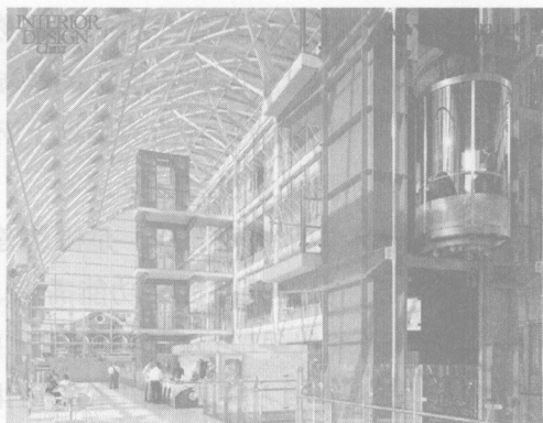
图 1-2 伦敦英国艾瓦丽娜 (Evelina) 儿童医院