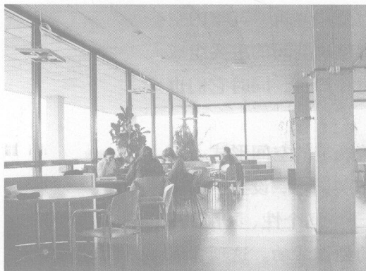
图 1-1 德国斯图加特大学生休息室