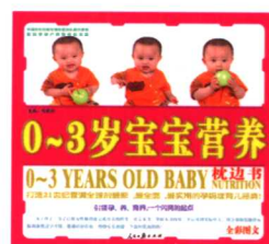
0-3岁宝宝营养枕边书