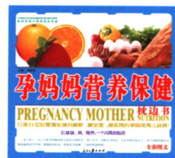
孕妈妈营养保健枕边书