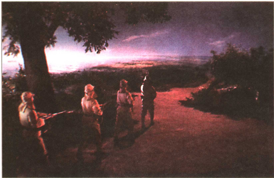
9. 一队全副武装的日本鬼子兵沿着公路巡逻而过。