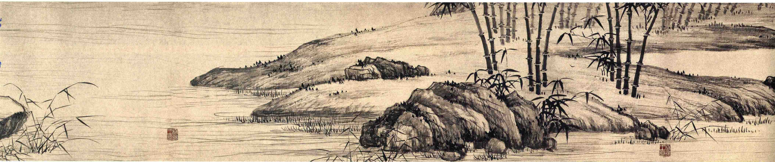
夏昶 淇澳图卷 明 纸本墨笔 纵30厘米 横1126.5厘米 故宫博物院藏