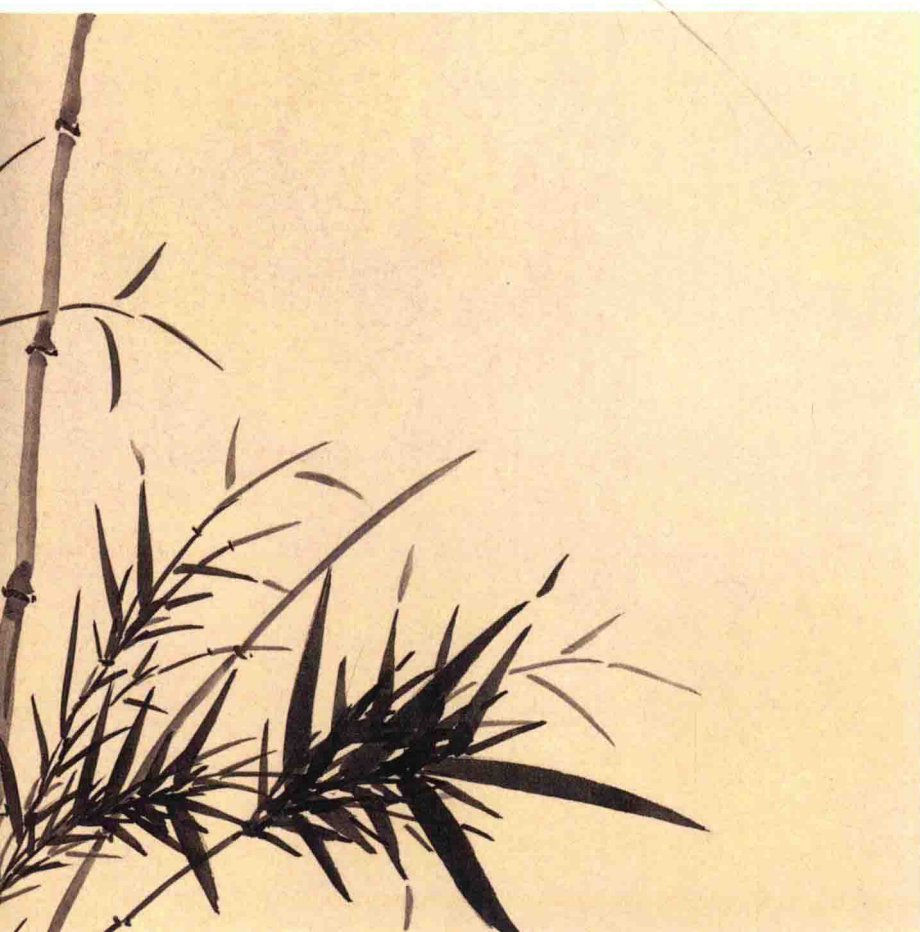
夏昶 淇水清风图卷（局部） 明 纸本墨笔 纵27.5厘米 横105.5厘米 故宫博物院藏