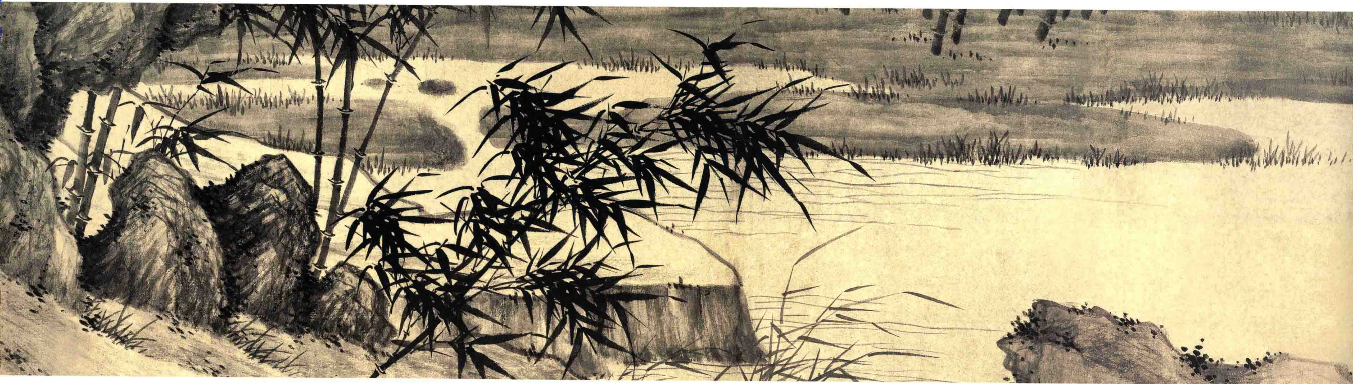
夏昶 潇湘风雨图卷 明 纸本墨笔 纵43厘米 横654.4厘米 上海博物馆藏