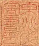
王绂 露梢晓滴图卷 明 纸本墨笔 纵33.1厘米 横79.3厘米 故宫博物院藏