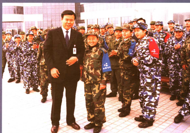
作者探望正在军训的一线员工。