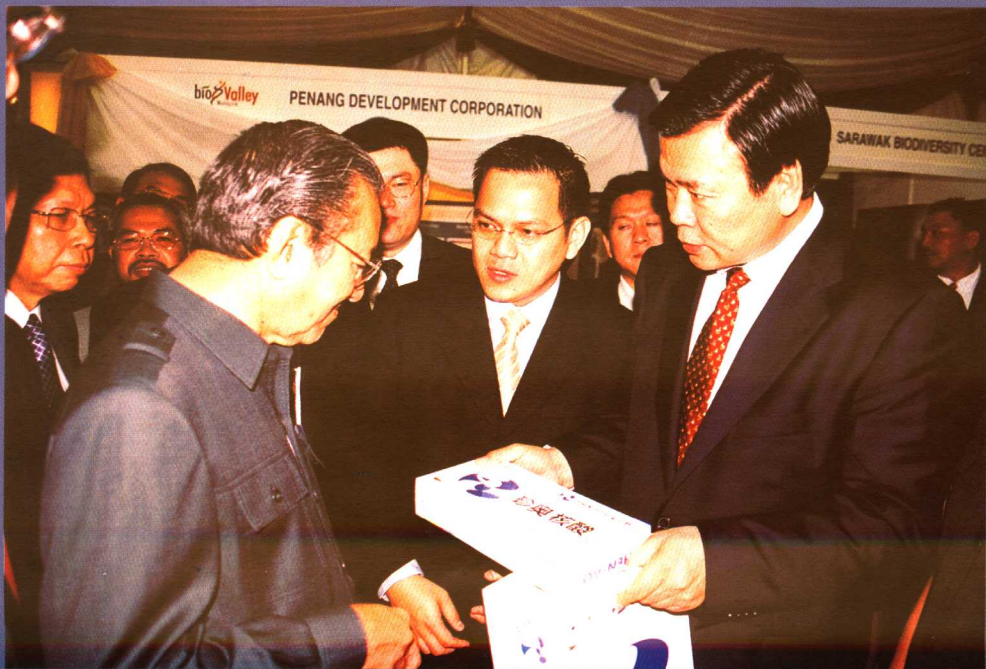
2003年5月20日珍奥正式落户马来西亚“生物谷”，在“生物谷”奠基大会上，马来西亚时任总理马哈蒂尔接见了作者，并接受作者赠送的珍奥核酸。