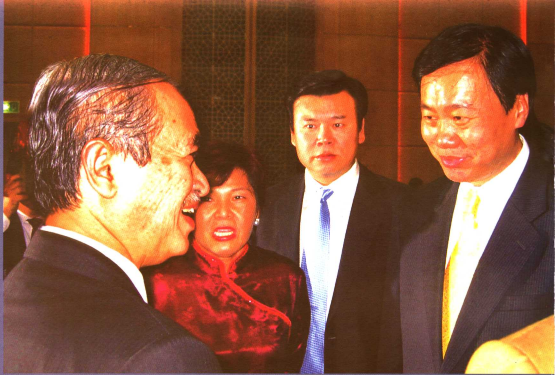
2003年12月18—23日作者陪同大连市长夏德仁（右）访问马来西亚时受到了现任总理巴达维的接见。