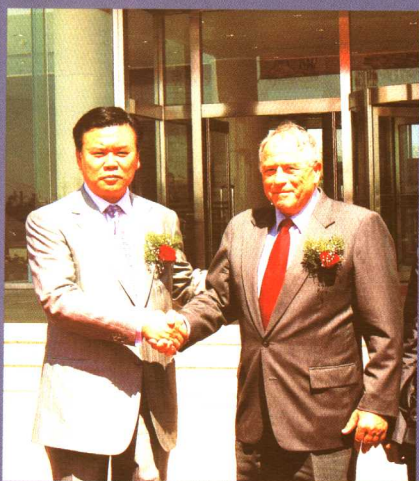
诺贝尔化学奖获得者、瑞士著名科学家科特·伍斯里奇博士2004年5月13日访问珍奥。

2004年6月18日在人民大会堂，世界免疫学联合会副主席、诺贝尔生理学及医学奖获得者、瑞士著名科学家青克纳格与珍奥签定合作协议后，做了长达两个小时的核酸学术报告。