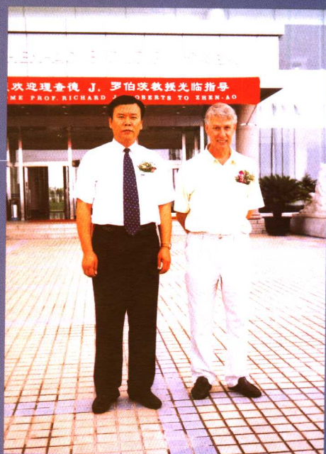
诺贝尔生理及医学奖获得者、美国著名科学家罗伯茨博士于2002年7月22日访问珍奥。

2001年4月，诺贝尔生理及医学奖获得者、瑞士著名微生物遗传学家韦尔纳·阿尔伯教授在瑞士巴塞尔大学生物中心他的办公室接见了作者。