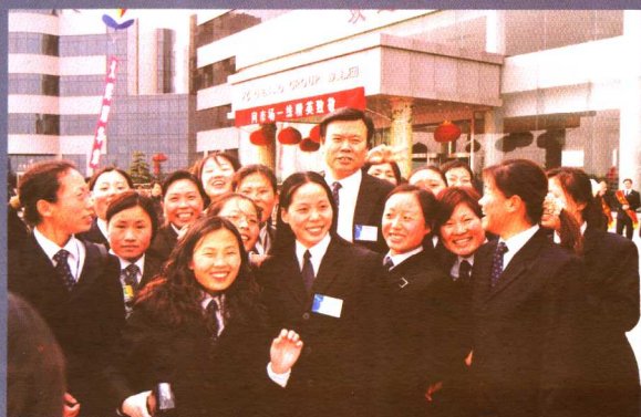
作者欢迎全国各地的一线员工回家。