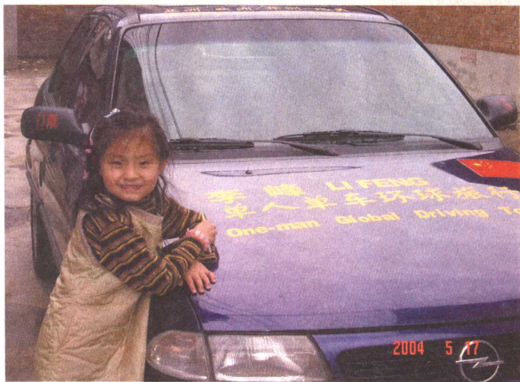
出发前一天女儿在爱车前 →

10 年后,我高中的班长,那位瘦小、只知道学习的黄毛丫头出落得亭亭玉立,而且成了我的妻子。虽然我们在整个高中的两年中彼此从未说过一句话,但命运还是把我们安排到了一起。1998 年女儿的降生让我体验到了做父亲的幸福,同时也渐渐带给我一些难言的苦恼。随着女儿渐渐长大,她对我和她妈妈小时候的事情变得格外好奇。我太太在小学、中学几乎年年是班长,当选过整个地区的“三好学生”,上大学后又是当班长,又是担任团支部书记。跟优秀的太太相比,我在女儿面前实在显得太逊色。我从小学到大学什么“职务”都没干过。小学时由于过分调皮,我是班里唯一没有戴过红领巾的学生。所以,每当跟女儿说起小时候的事情,或是她有意无意地将我和她妈妈做比较时,我总觉得尴尬和“掉价”。这让我在潜意识里一直有做一件“大事”、迅速提升自我形象的愿望。这种愿望随着女儿一天天地长大变得越来越迫切。问题是:大事在哪儿?我