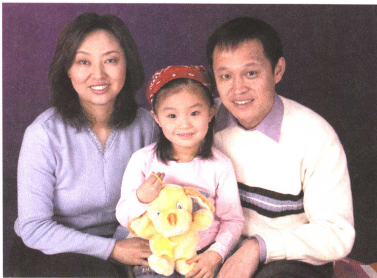
←女儿四岁时的全家福

我没上过幼儿园，对小学的记忆是写不完的检查、打不完的架、老师们告不完的状态和一直不上不下的学习成绩。唯一美好的记忆是小学二年级参加跳绳比赛获得过年级组的第三名，奖品是一盒蜡笔。这是我整个学