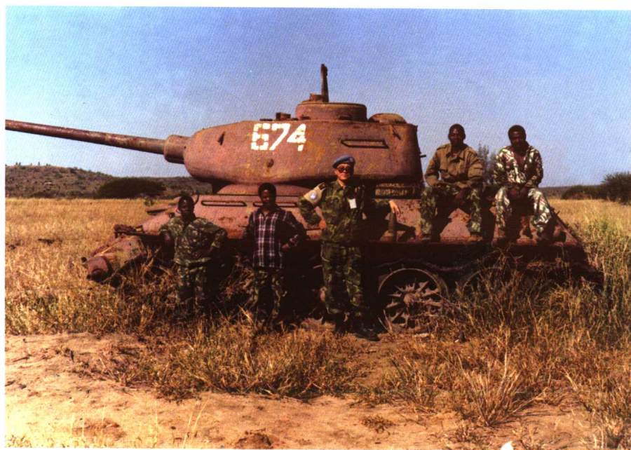
和集结区的政府军士兵在一起