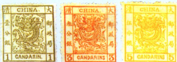
清普 1.3 大龙厚纸

邮票的面值与邮票的售价一般是相等的,邮局与邮票代售处无权以高于或者低于邮票面值的价格出售邮票。但有的邮票在出售时,邮政部门就规定了售价超出面值。邮票超过了规定的邮局出售时限,其售价一般会超出邮票面值。