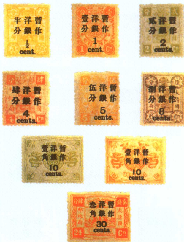
清普6 慈禧寿辰(初版)大字长距改值邮票

邮票票型指邮票的形状与式样，从规格上可分为大型、中型、小型等。形状上，邮票通常是矩形的，但也有三角形、菱形、圆形和其他形状的邮票。