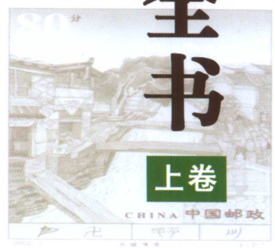
丽江古城 Lijiang Gucheng