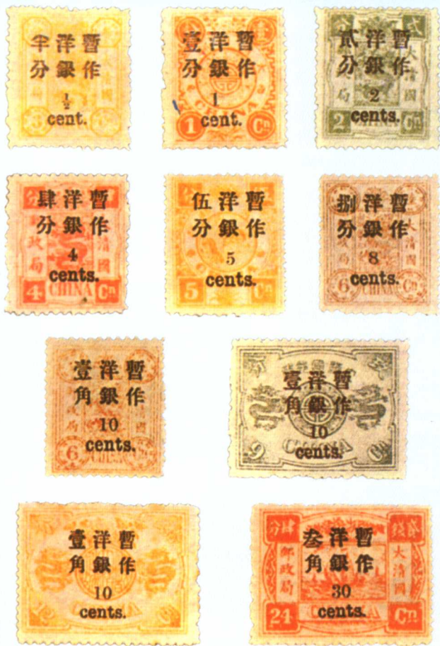
清普5 慈禧寿辰(初版)加盖小字改值邮票

1897年1月2日发行。全套10枚，分别是慈禧寿辰3分银加盖半分，1分银加盖1分，2分银加盖2分，4分银加盖4分，5分银加盖5分，6分银加盖8分，6分银加盖1角，9分银加盖1角，12分银加盖1角，2钱4分银加盖3角。加盖全张：小型票为横双格，共40枚；大型票9分银加盖1角，为全格撕去左边一行后的4×5计20枚，其余两种为一全格5×5共25枚。全套市场价格新票4400元，旧票2800元。