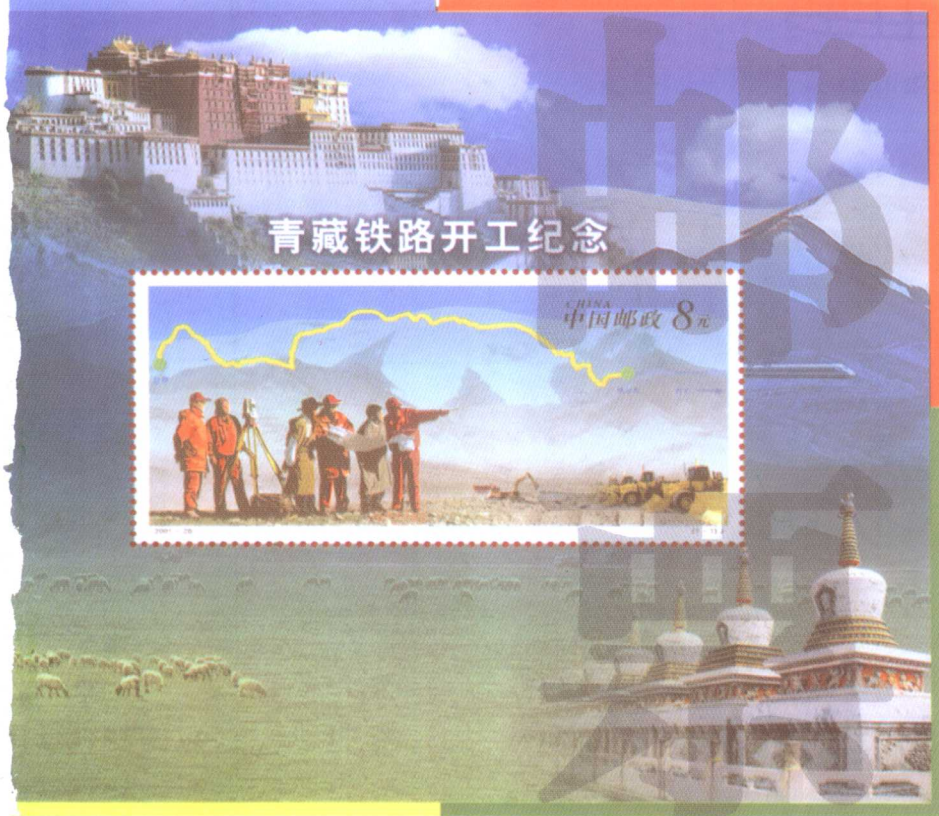
青藏铁路开工纪念