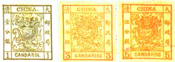
清普 1.2 大龙阔边

我国自1949年新中国成立后至1991年,这期间发行的邮票先后印有“中华人民邮政”、“中国人民邮政”字样。从1992年起发行的邮票印有英文“CHINA”和“中国邮政”字样,把国名和邮政标记分印。