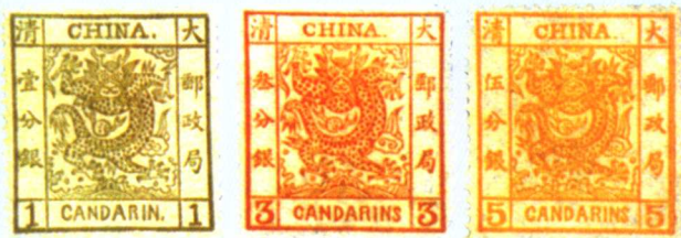
清普 1.1 大龙薄纸

世界各国(地区)的早期邮票图案都比较简单。随着时代的发展,当今世界各国(地区)都把本国(地区)在政治、经济、文化、艺术、科学技术、自然风光、历史地理、珍稀动植物等方面最有代表性的内容展现在邮票图案上。