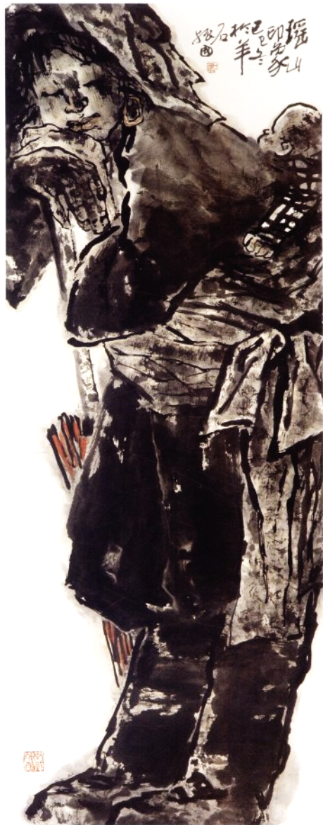
瑶山印象 130 × 52cm