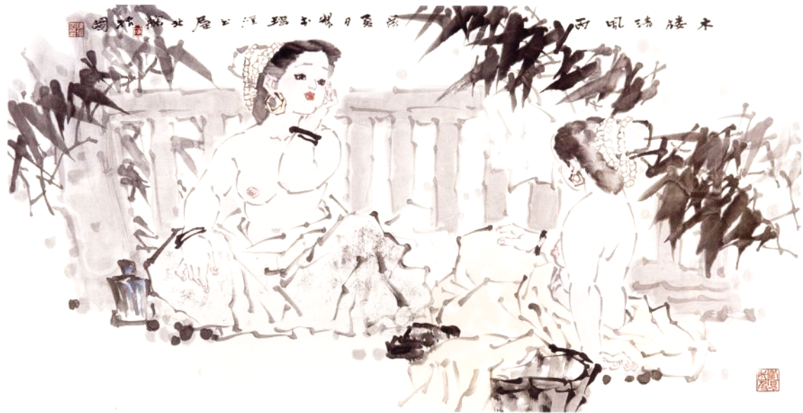
木楼清风 109 x 118 cm