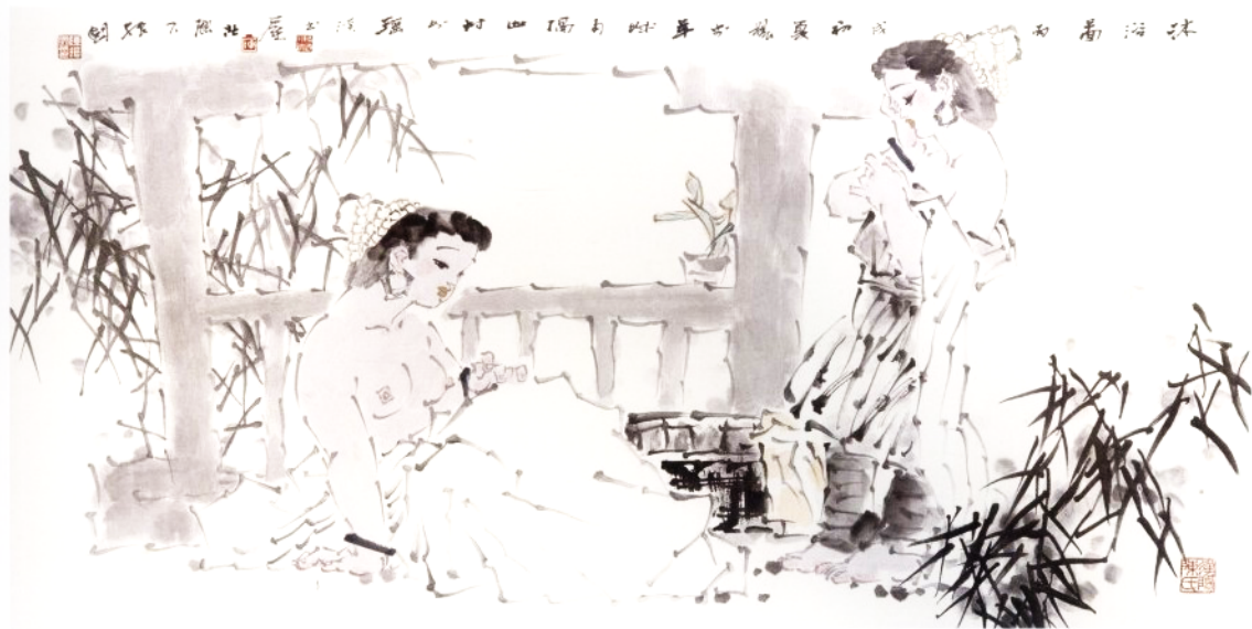
沐浴图 69 x 135 cm