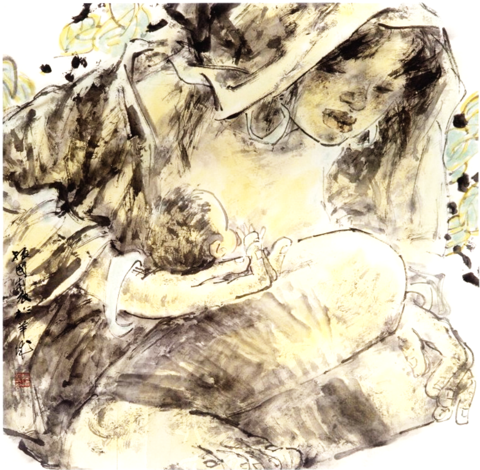
母子图 67 x 66cm