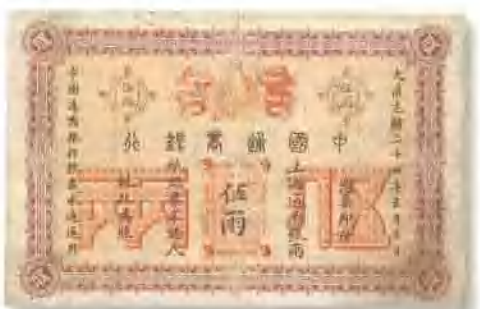
光緒二十四年 (1898) 中國通商銀行上海伍兩 少見，背有轉微貼版，七成新。 市場參考價：RMB 3,500 成交價：RMB 6,050