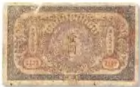
光绪三十二年 (1906) 大清户部银行兑换券汉口壹圓 六五成新， 市场参考价:RMB 300 成交价:RMB 550