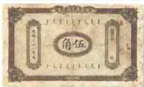
光緒三十一年 (1908) 奉天官銀號銀元票伍角 有破損,六成新。 市場參考價:RMB 3,000 成交價:RMB 4,620