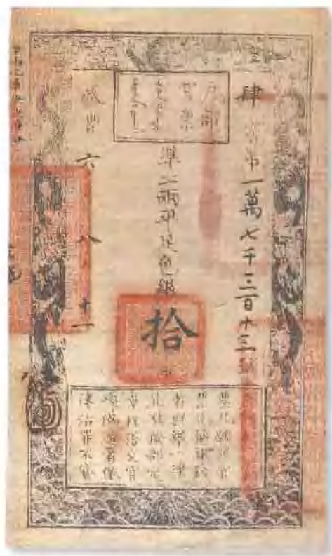
咸丰六年 (1856) 户部官票拾两 有背书散处，九五成新。 市场参考价: RMB 3,500 成交价: RMB 5,720