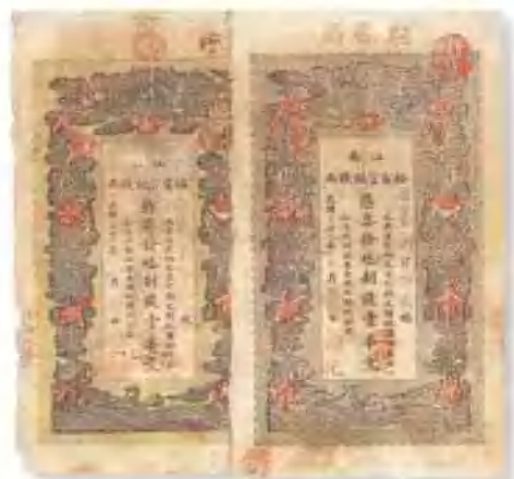
光緒二十九年 (1903) 江南裕甯官銀錢局壹串文 (2枚) 其中一枚舊有膠帶貼痕,七成新。 市場參考價:RMB 1,500 成交價:RMB 4,180