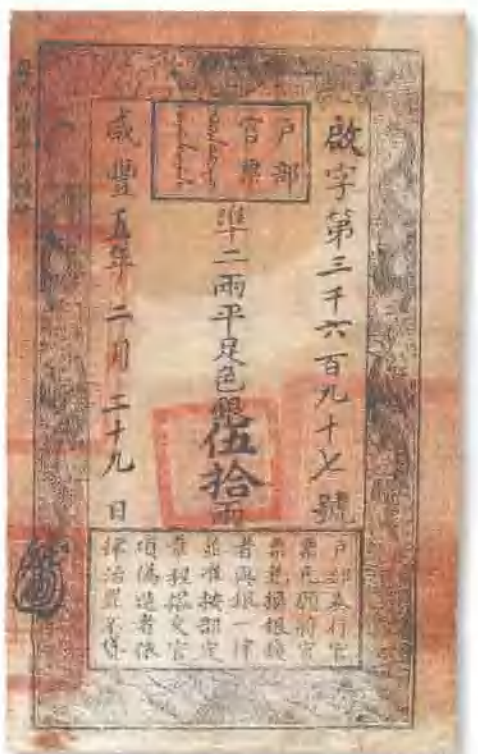
咸丰五年 (1855) 户部官票伍拾两 有背书散处，九成新。 市场参考价: RMB 10,000 成交价: RMB 18,700