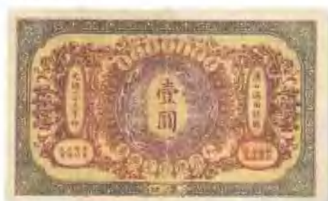
光緒三十三年 (1907) 大清戶部銀行兌換券漢口壹圓 票上有針孔戳,八成新。 市場參考價:RMB 1,000 成交價:RMB 1,430