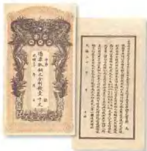
光緒三十二年 (1906) 四川銅元局壹千文 少見,九成至九五成新,難得。 市場參考價:RMB 10,000 成交價:RMB 27,500