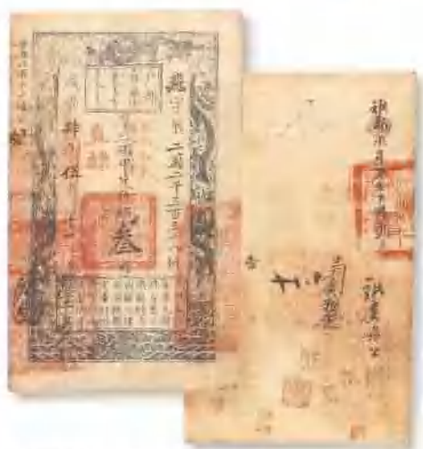
咸丰四年 (1854) 户部官票叁两 有背书散处，八五成新。 市场参考价: RMB 2,500 成交价: RMB 6,800