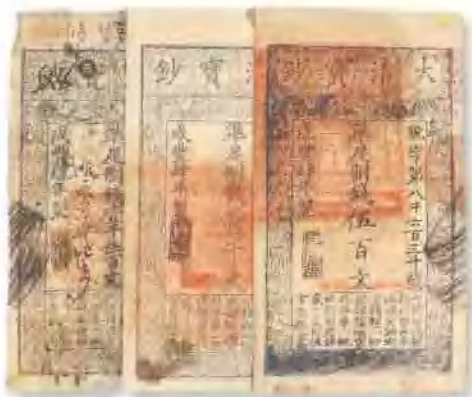
咸丰四年 (1854) 户部官票拾两 有背书数处，有破洞，七成新。 市场参考价：RMB 3,500 成交价：RMB 2,750