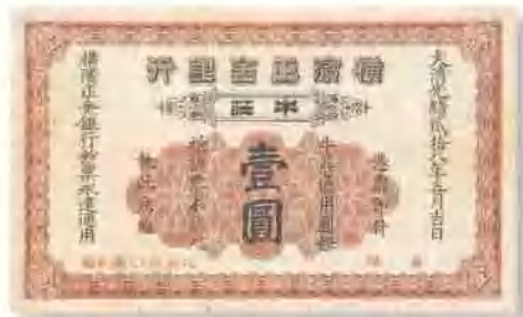
光緒二十八年 (1903) 橫濱正金銀行牛庄銀行壹圓 較為少見, 邊紙處微損, 七五成新。 市場參考價: RMB 5,000 成交價: RMB 8,800