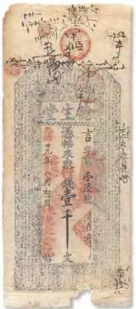
光緒二十九年 (1903) 東陽德生堂銀票壹千文 下部微損, 七成新。 市場參考價: RMB 1,000 成交價: RMB 880