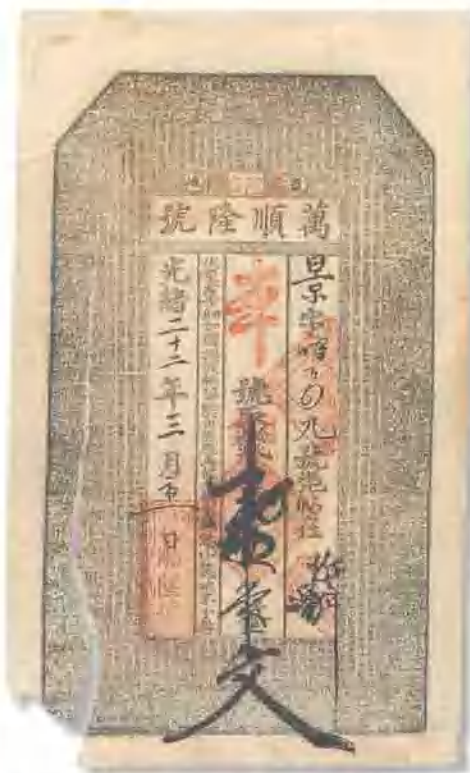
光緒二十二年 (1896) 萬順隆號錢莊銀票壹串文 左側撕裂開缺左下角，七成新。 市場參考價：RMB 1,000 成交價：RMB 1,320