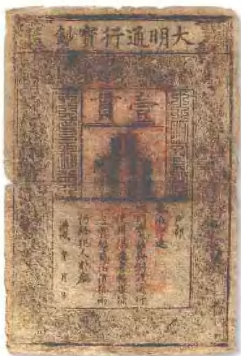
大明通行宝钞壹贯 八五成新。 市场参考价:RMB 10,000 成交价:RMB 7,480