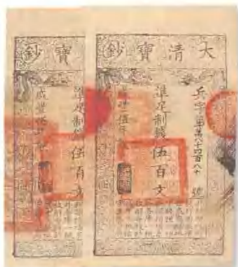
咸丰五年 (1855) 大清宝钞伍百文 (2枚连号) 九五成新至全新。 市场参考价：RMB 1,200 成交价：RMB 1,980