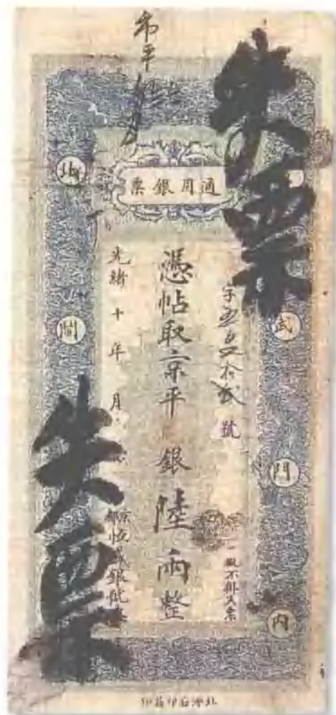
光緒十年 (1884) 北京恒盛銀號通用銀票陸兩 票上用毛筆書寫“失票”二字， 較少見。背面貼銀一處，七五成新， 市場參考價：RMB 1,000 成交價：RMB 1,540