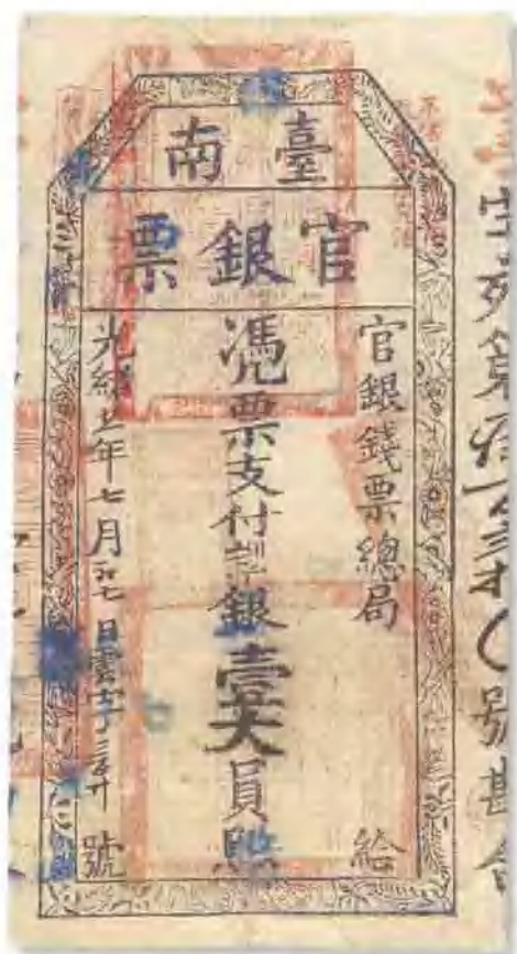
光緒二十一年 (1895) 台南官銀票壹大員 加蓋“不許權使行用銀票軍出巡治”； 較少見，背有貼版，八成新。 市場參考價：RMB 3,500 成交價：RMB 4,620