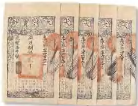
咸丰七年 (1857) 大清宝钞貳千文 (5枚连号)