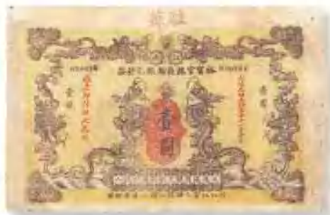
光緒三十一年 (1905) 江南裕甯官銀錢局銀元 鈔票壹圓 少見,七五成新。 市場參考價:RMB 4,000 成交價:RMB 20,350