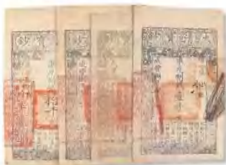
咸丰八年 (1858) 大清宝钞一组 (3枚)