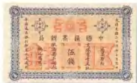
光緒二十四年 (1898) 中國通商銀行北京伍錢 少見，九成至九五成新，品相好者難尋。 市場參考價：RMB 5,000 成交價：RMB 11,000