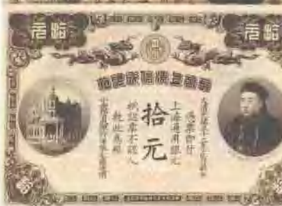
光緒三十三年 (1907) 華商上海信成銀行壹元、伍元、拾元 (各1枚) 少見,九五成新至全新。 市場參考價:RMB 20,000 成交價:RMB 38,500