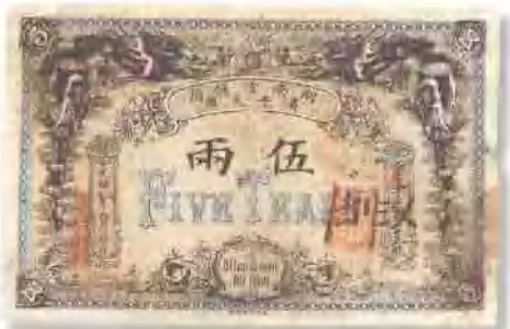
光緒三十二年 (1906) 湖南官錢局伍兩 邊部有輕微破損, 七五成新。 市場參考價: RMB 2,000 成交價: RMB 4,620