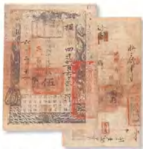
咸丰六年 (1856) 戶部官票伍兩 有背書數處，背有貼版，八成新。 市場參考價：RMB 3,000 成交價：RMB 6,820