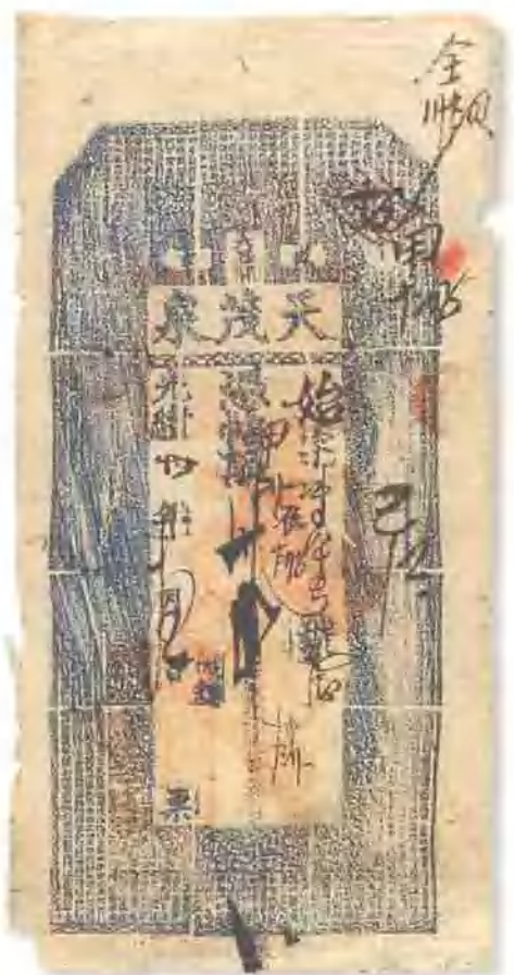
光绪三十年 (1904) 沈阳天茂泉银号银票州串 包纸, 略有破损, 八成新。 市场参考价: RMB 1,000 成交价: RMB 1,320