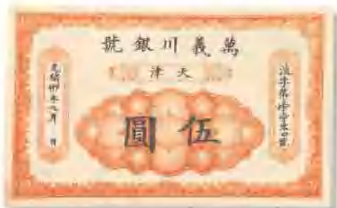
光緒三十年 (1904) 萬義川銀號天津伍圓 九成至九五成新。 市場參考價：RMB 1,500 成交價：RMB 1,980