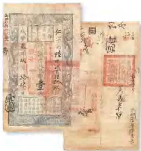
咸丰三年 (1853) 户部官票壹两 有背书数处，八成新。 市场参考价：RMB 1,500 成交价：RMB 4,380