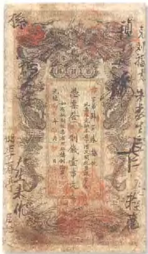
光緒三十二年 (1906) 湖南官錢局壹串文 七成新。 市場參考價: RMB 600 成交價: RMB 990