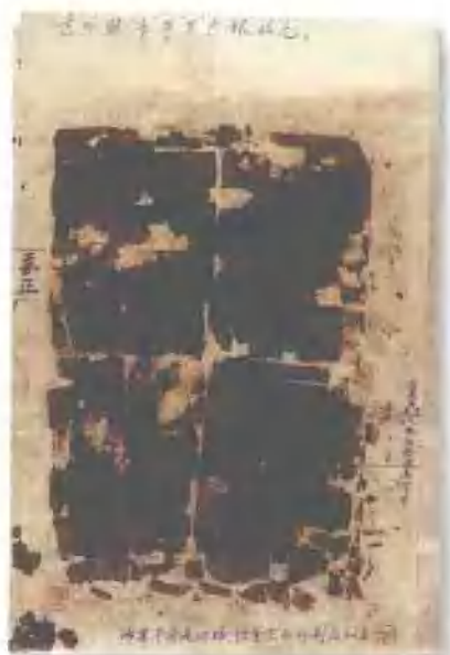
元代至正年间印行之“平准库库足钱”纸钞 著名学者卫聚贤编撰《钱的故事》一书中刊有此钞，另未见任何著录。纸写，保存至今极为不易，此币为马定祥先生旧藏。 市场参考价:RMB 6,100 成交价:RMB 5,500