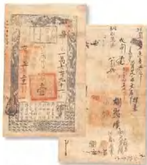
咸丰六年 (1856) 户部官票壹两 有卷折十余处，八成新。 市场参考价：RMB 1,500 成交价：RMB 3,300