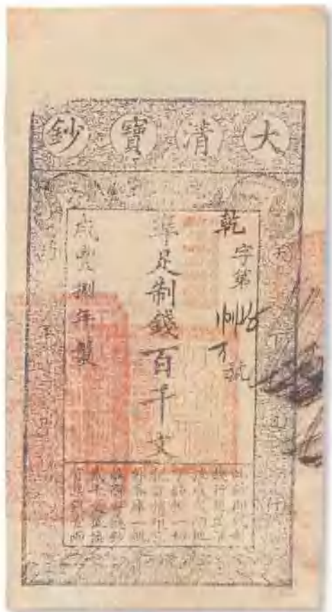
咸丰八年 (1858) 大清宝钞百千文