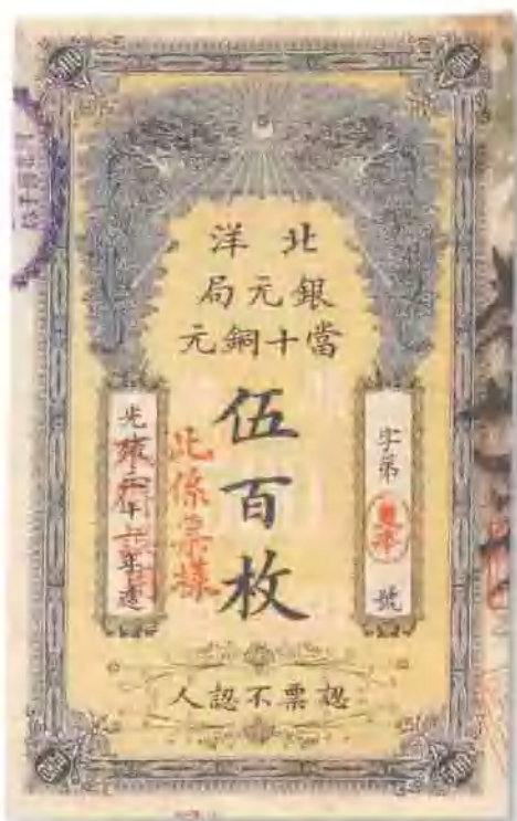
光绪三十一年 (1905) 北洋銀元局當十銅元伍百枚样票

加盖“此系票样不得混用”，“见本”字样。 少见，背部局部揭薄，八五成新。 市场参考价:RMB 5,000 成交价:RMB 15,400