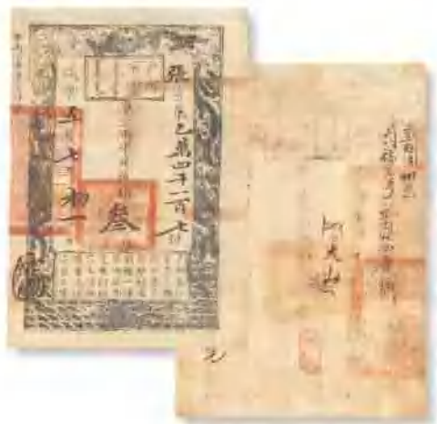
咸丰五年 (1855) 户部官票叁两 有背书散处，九成新。 市场参考价: RMB 2,500 成交价: RMB 4,620