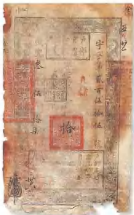
咸丰三年 (1853) 户部官票拾两 手写序，很少见，有背书数处，有破洞，七成新。 市场参考价：RMB 10,000 成交价：RMB 8,800