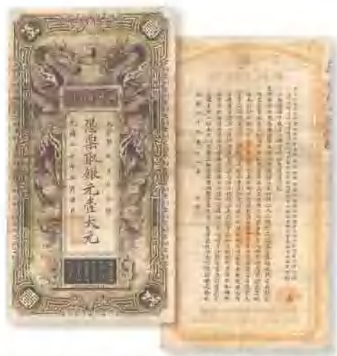
光绪三十年 (1904) 湖北官钱局银元壹大元 少见, 八成新。 市场参考价: RMB 6,000 成交价: RMB 11,000