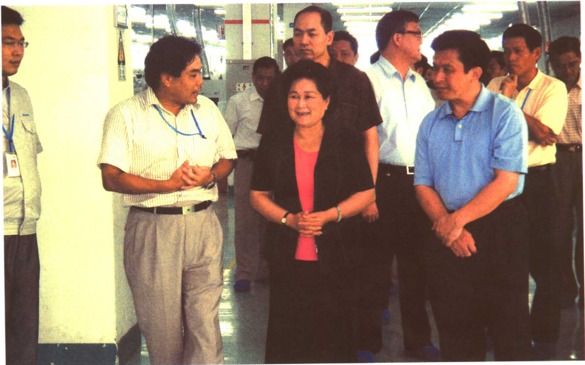
2005年8月，劳动保障部副部长华福周赴福建进行协调劳动关系三方机制调研。