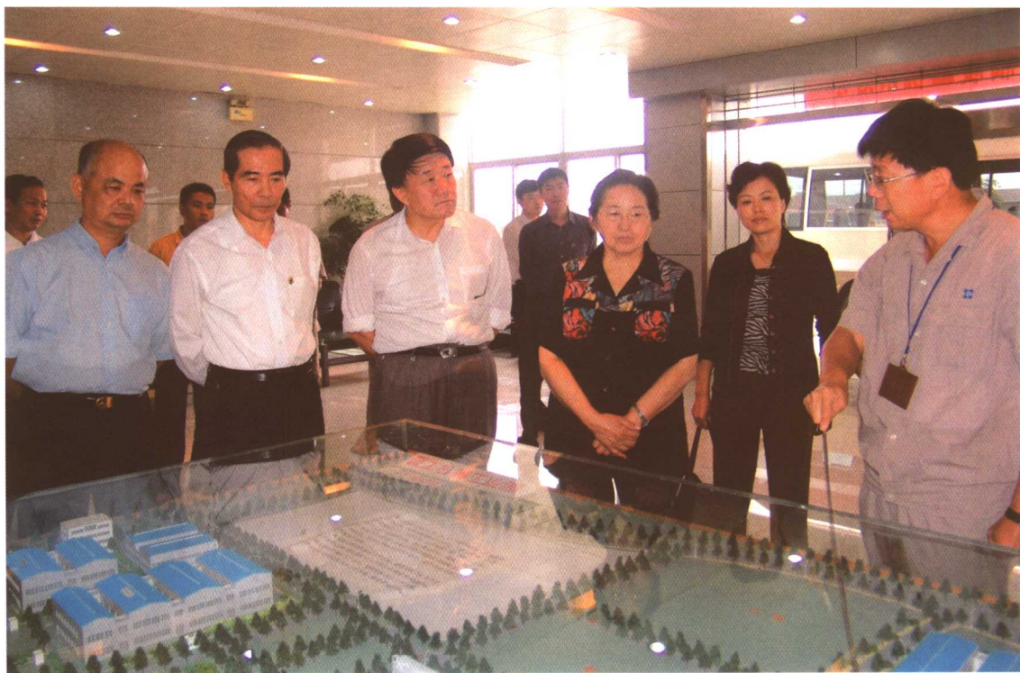
2005年11月，全国人大常委会副委员长何鲁丽（右三）率全国人大《劳动法》执法检查组在厦门工程机械厂听取企业情况介绍。