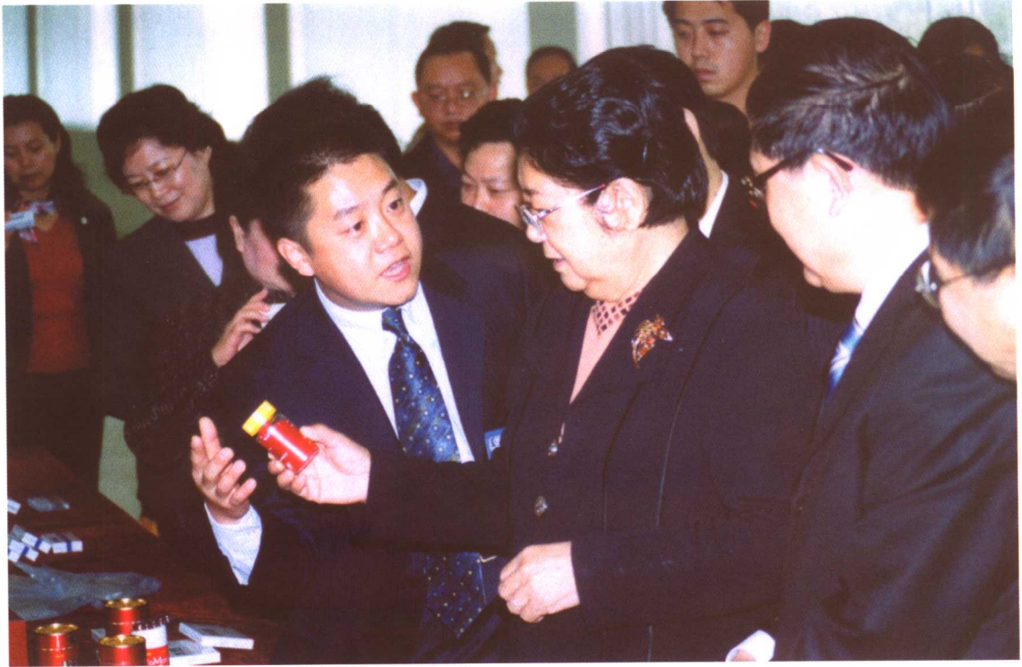
2005年11月，全国人大常委会副委员长顾秀莲（中）率全国人大《劳动法》执法检查组在湖南进行劳动法执法检查。