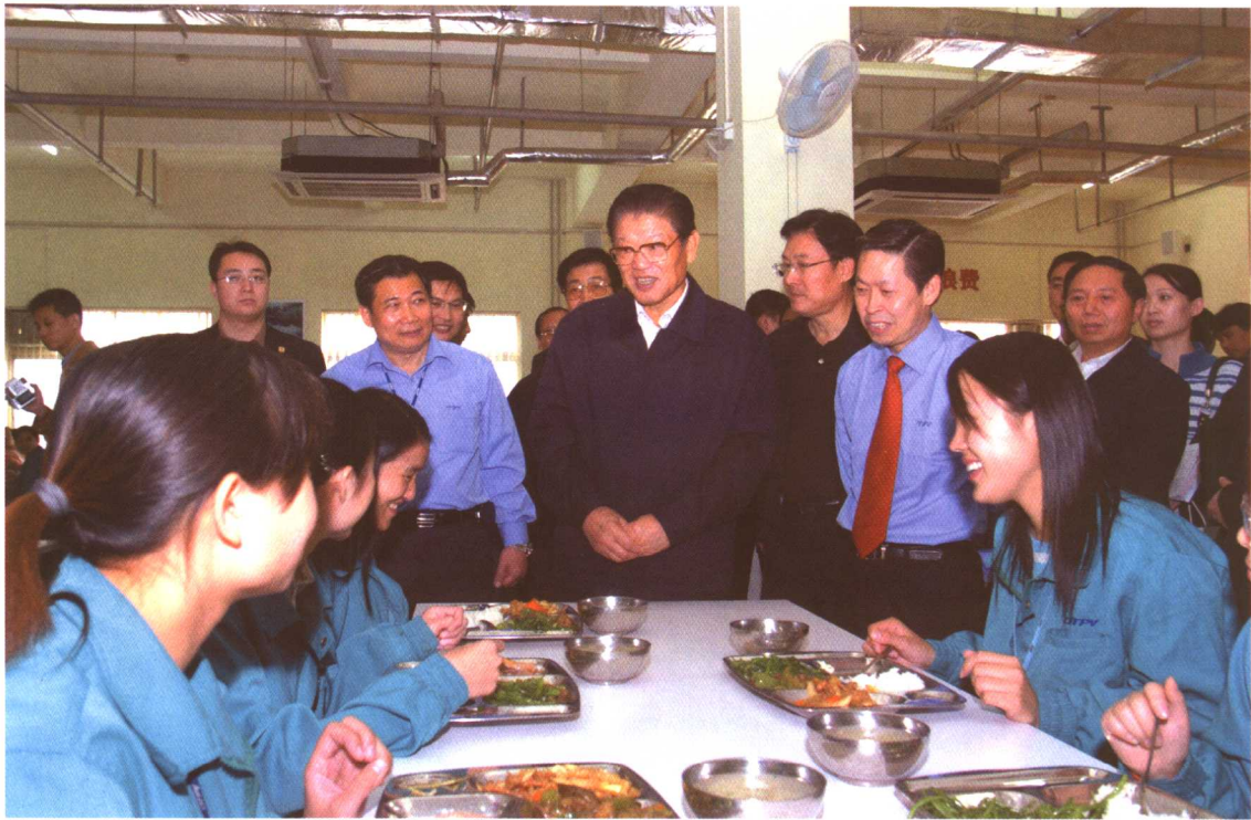
2005年10月，全国人大常委会副委员长李铁映（中）率全国人大《劳动法》执法检查组在北京东方冠捷公司了解职工工资和社会保险情况。