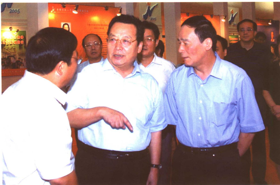
2005年8月24日，劳动保障部部长田成平（中）在北京市市长王岐山（右一）、副市长孙安民等陪同下参观了首都技能人才培养成果展示。