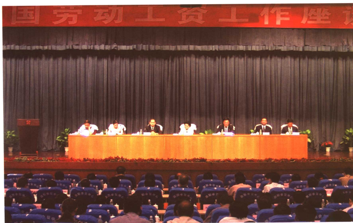
2005年6月24日至25日，全国劳动工资工作座谈会在黑龙江省哈尔滨市召开。劳动保障部副部长华福周出席会议并讲话。