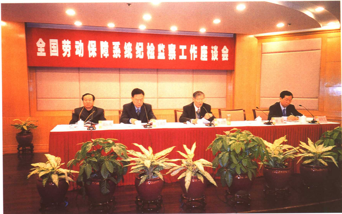
2005年1月18日，全国劳动保障系统纪检监察工作座谈会在广州市召开。中纪委驻部纪检组组长崔会烈出席会议并讲话。