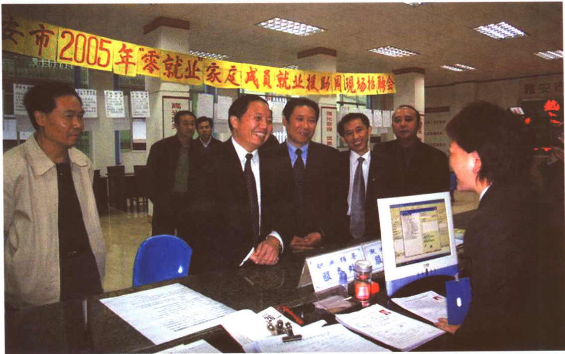
2005年10月，劳动保障部副部长步正发考察四川省雅安市就业指导中心。