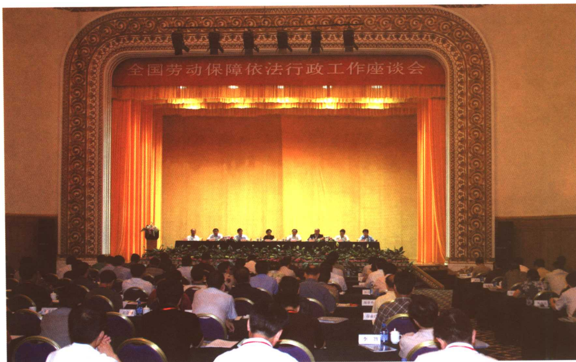
2005年7月15日至16日，全国劳动保障依法行政工作座谈会在大连市召开。劳动保障部副部长步正发出席会议并讲话。