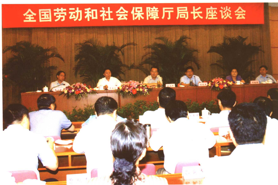
2005年7月22日，全国劳动保障厅局长座谈会在北京召开。劳动保障部部长田成平，副部长王东进、步正发、华福周、张小建、刘永富出席。田成平在会上讲话。王东进代表部党组通报上半年劳动保障工作进展情况，部署下半年工作。