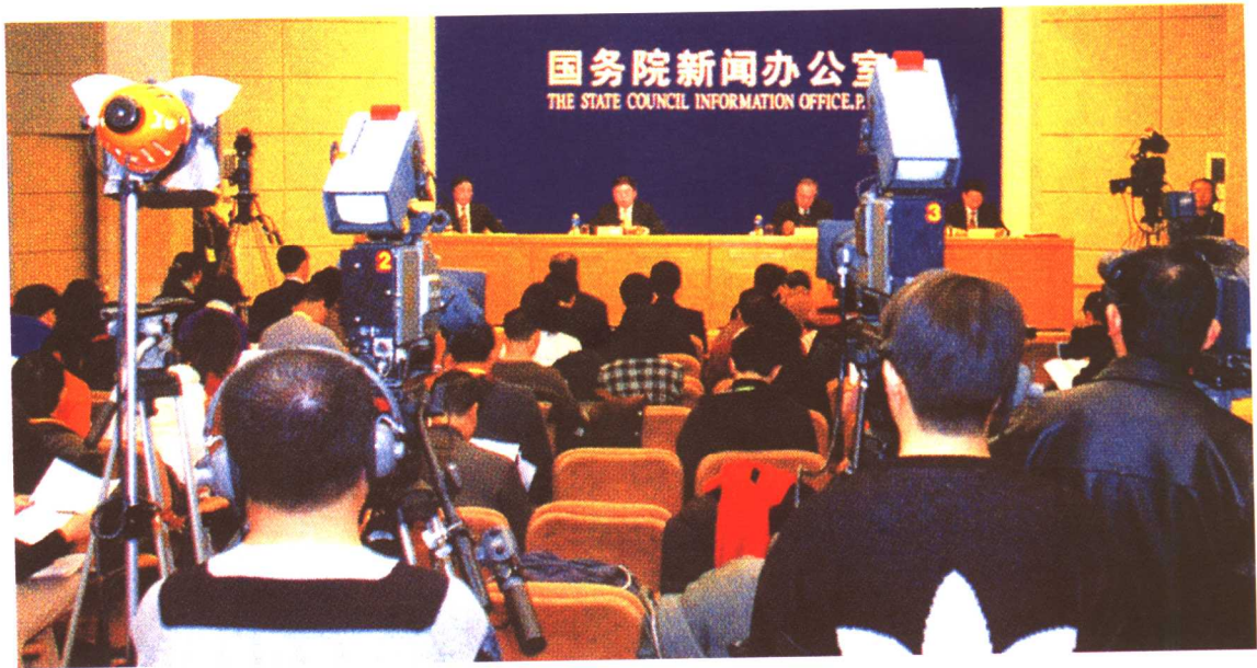
2005年12月15日，国务院新闻办公室召开新闻发布会，发布国务院关于完善企业职工基本养老保险制度的决定。劳动保障部副部长刘永富出席并回答记者提问。