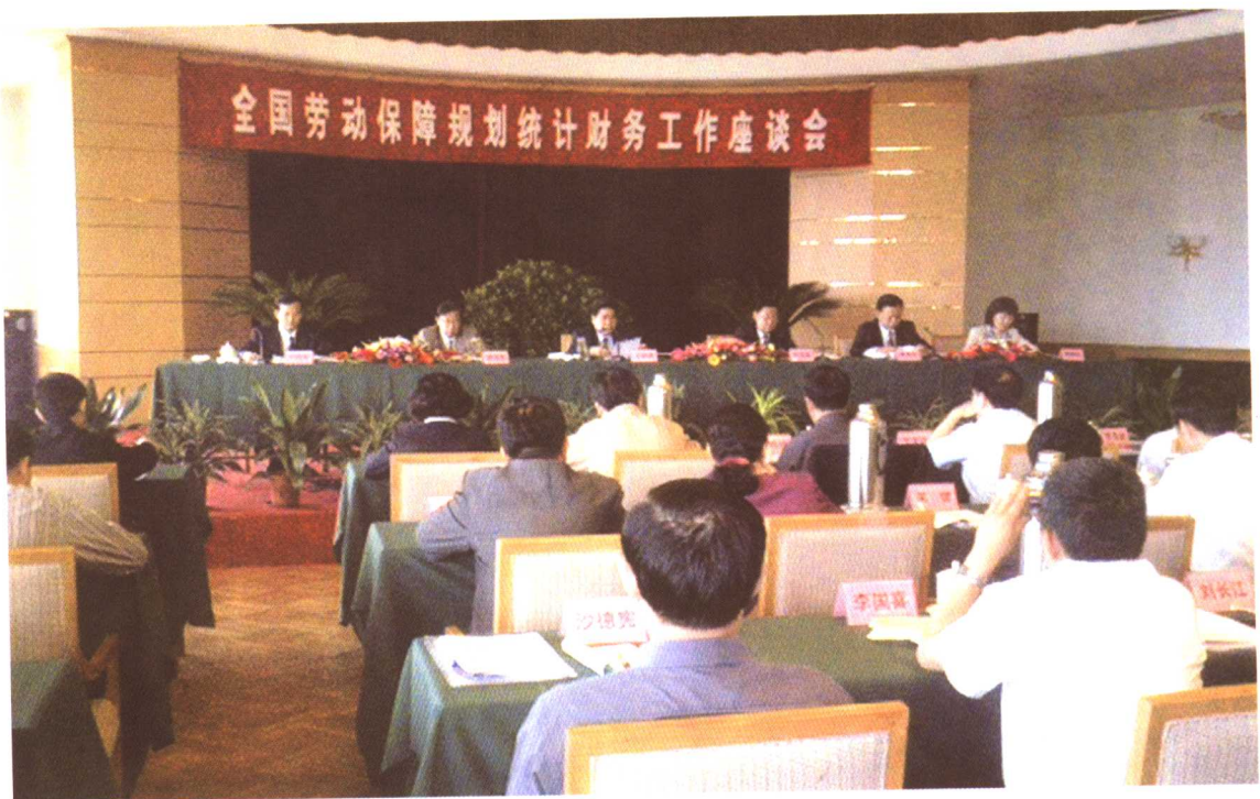
2005年5月12日至13日，全国劳动保障规划统计财务工作座谈会在山东省济南市召开。劳动保障部副部长王东出席会议并讲话。