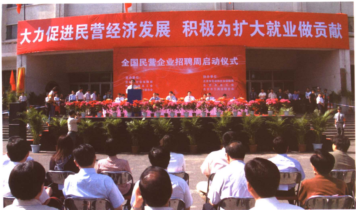
2005年6月6日至12日，劳动保障部、中华全国总工会、中华全国工商业联合会在全国100个大中城市联合组织开展“民营企业招聘周”活动。6月6日，“民营企业招聘周”活动启动仪式在北京市工人体育馆举行。全国政协副主席、中华全国工商业联合会主席黄孟复出席启动仪式，劳动保障部部长郑斯林和中华全国总工会副主席张俊九、中华全国工商业联合会副主席胡德平、北京市副市长孙安民分别讲话，劳动保障部副部长张小建主持启动仪式。