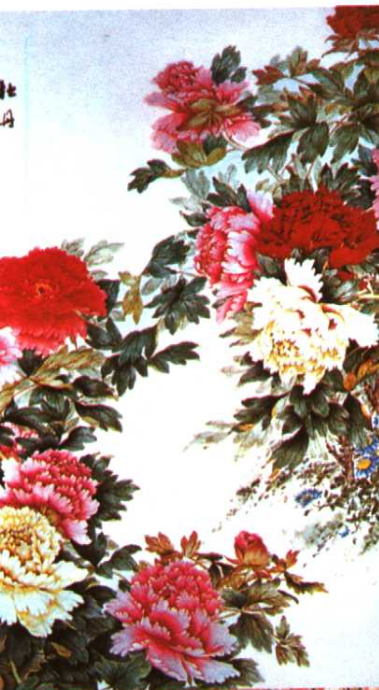
雕龙栏柱（西夏陵6号陵出土） 西夏文残碑（西夏陵出土） 鎏金铜牛（西夏陵101号墓出土） 回族女画家曾杏绯的国画《牡丹》 丝织品（拜寺口双塔出土） 卷轴画《水月观音图》（黑水城出土） 卷轴画《释迦牟尼说法图》中的随侍菩萨（黑水城出土）