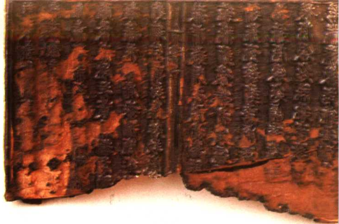
拜寺口双塔塔身影塑兽面 木雕板（宏佛塔出土） 彩绘木雕上乐金刚（拜寺口双塔出土） 贺兰山岩画——鹿 鸱吻（西夏陵6号陵出土）