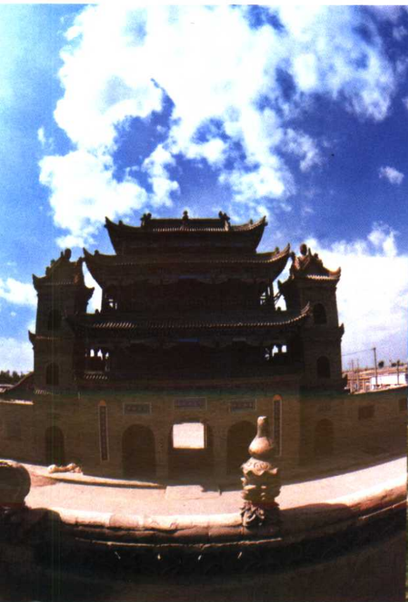
西夏陵 3 号陵西碑亭 纳家户清真寺 横城堡明长城