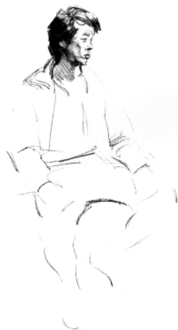
4. 画出人物头部和五官的细部特征。