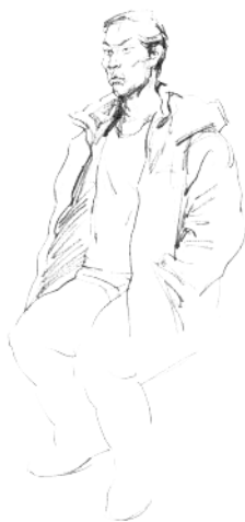
6. 画出双臂，注意其插在口袋中的姿势。