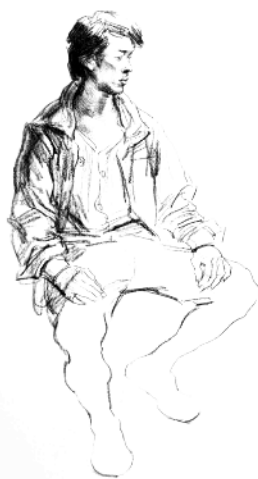
7. 画出腰臀部的衣纹变化。