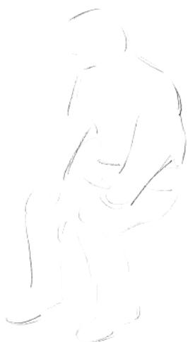
3. 确定人物下半身的位置和基本轮廓。