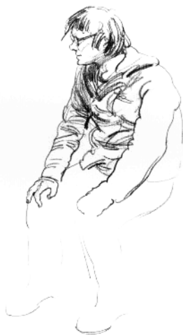
5. 画出右臂和右手，丰富上半身的衣纹变化。