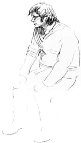
4. 画出人物头部和五官的细部特征。