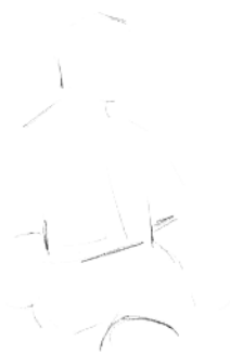
2. 确定人物上半身及腰部的基本轮廓。