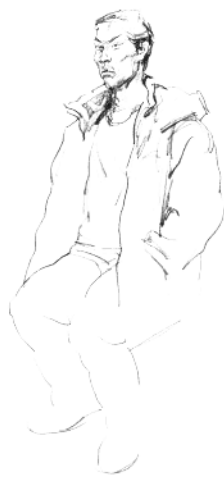
5. 画出衣领和上半身的衣纹变化。