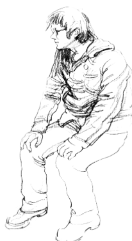
9. 画出左腿的衣纹变化。