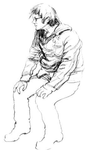
7. 画出腰胯部的衣纹变化。