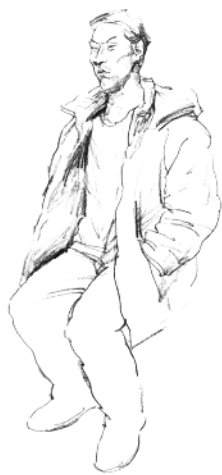
7. 画出腰胯部的衣纹变化。