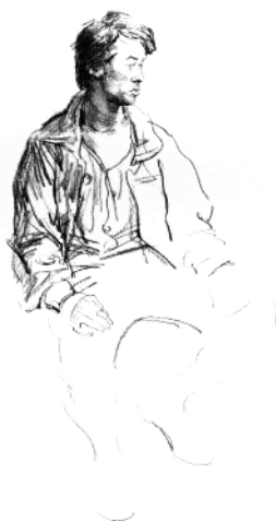
5. 画出右臂和右手，丰富上半身的衣纹变化。