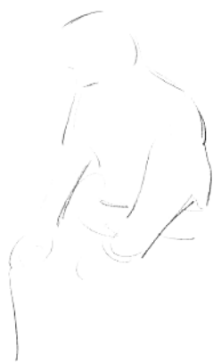
2. 确定人物上半身的位置和基本轮廓。