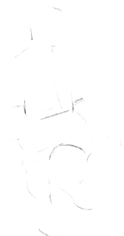
3. 确定人物下半身的基本轮廓。