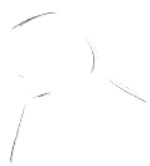
1. 确定人物头、肩部的位置和基本轮廓。