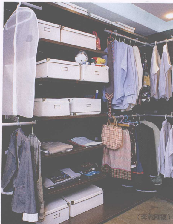
定期整理才能有干净清爽的居住空间。

收纳要有方法，有次序地工作才能收得又快又好。在开始收纳之前，将先教你收纳整理的重点部位，以及如何安排有效地收纳流程，让你轻松收纳不费力，越收越快乐！