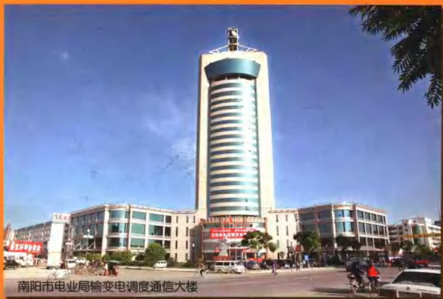
南阳市电业局输变电调度通信大楼