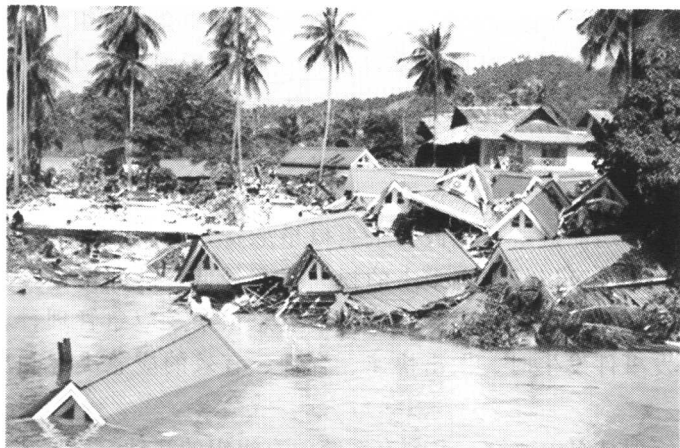
图 1-1 印度洋海啸后的情景

如 2004 年 12 月 26 日发生的印度洋地震海啸灾难，由于受灾国家对突发公共事件管理缺乏足够的认识，既未制定有关应急预案，进行必要的制度准备、技术准备和物资准备，也没有对各种人员进行海啸逃生的各种宣传和培训，当海啸发生时，没有任何预警信息和预警措施，结果造成巨大的死亡和损失。在这次地震海啸灾难中，共有 29.2 万多人死亡，数百万人无家可归。图 1-1 为印度洋海啸后的情景。