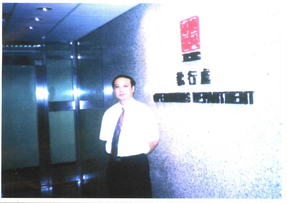
● 作者在香港廉政公署办案期间的留影