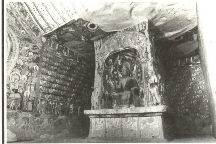
图3 北魏的中心柱窟 莫高窟第257窟，主室中央有一个象征佛塔的方柱，即中心塔柱。塔柱四面开龕造像。窟顶前部为仿汉式建筑的人字披顶。