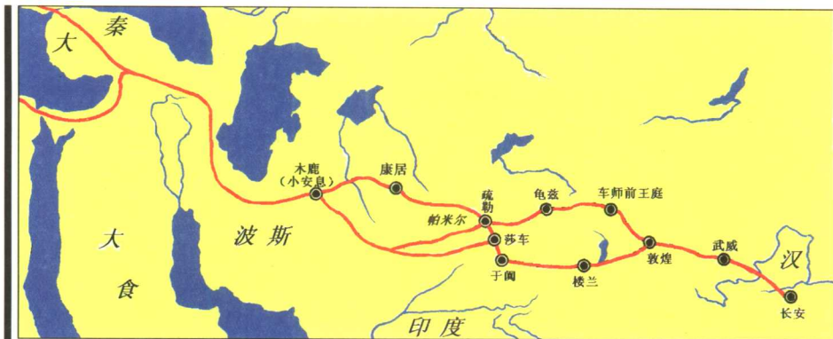
图1 丝绸之路示意图

文化的一致性。那么通过敦煌文化，我们就可以了解当时中原文化的特性。在今天中原文化遗存较少的情况下，就显示出它的重要参照意义。