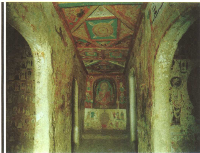
图2 早期的禅窟 莫高窟北凉第268窟，主室较窄，正面开龕造像，两侧各开两个小禅室，供僧人坐禅。