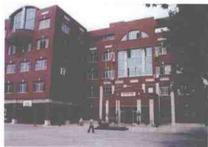
学术瑰宝丰厚的信息楼