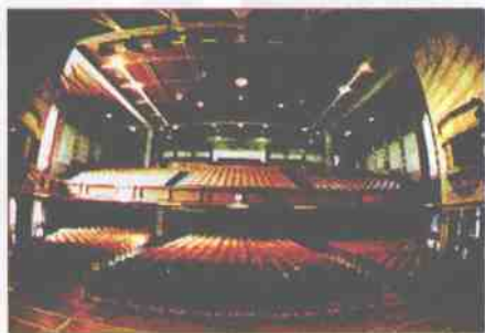
美轮美奂的礼堂内部