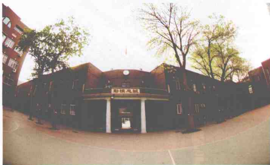
历久弥新的醒世碑