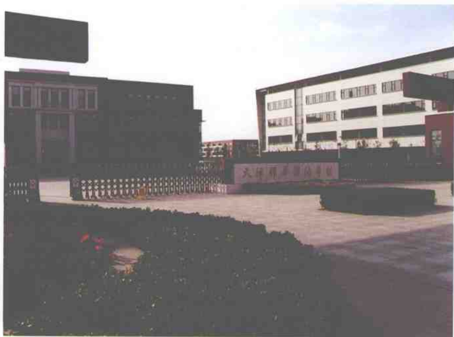
天津耀华滨海学校