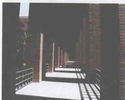
光影变化的知识长廊