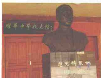
校史馆前赵天麟校长铜像