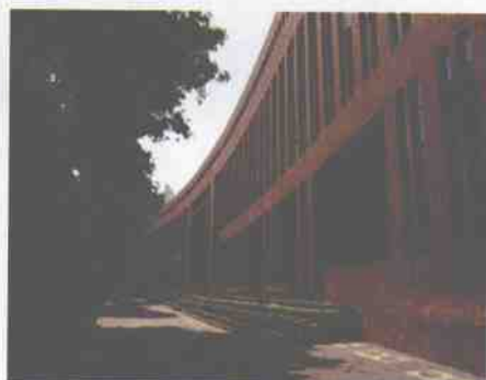
雄伟壮观的新教学楼外沿