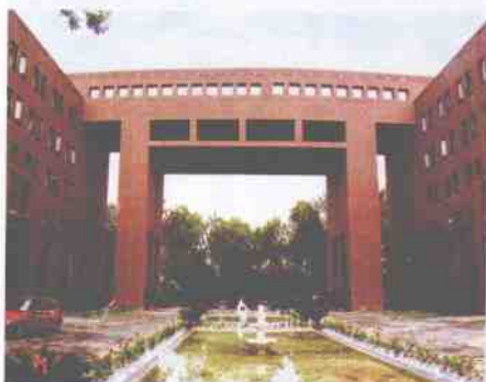
气势恢宏的山西路校门