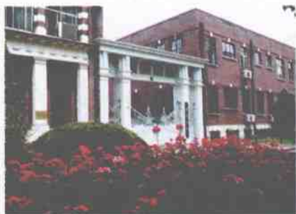
典雅的南京路校门