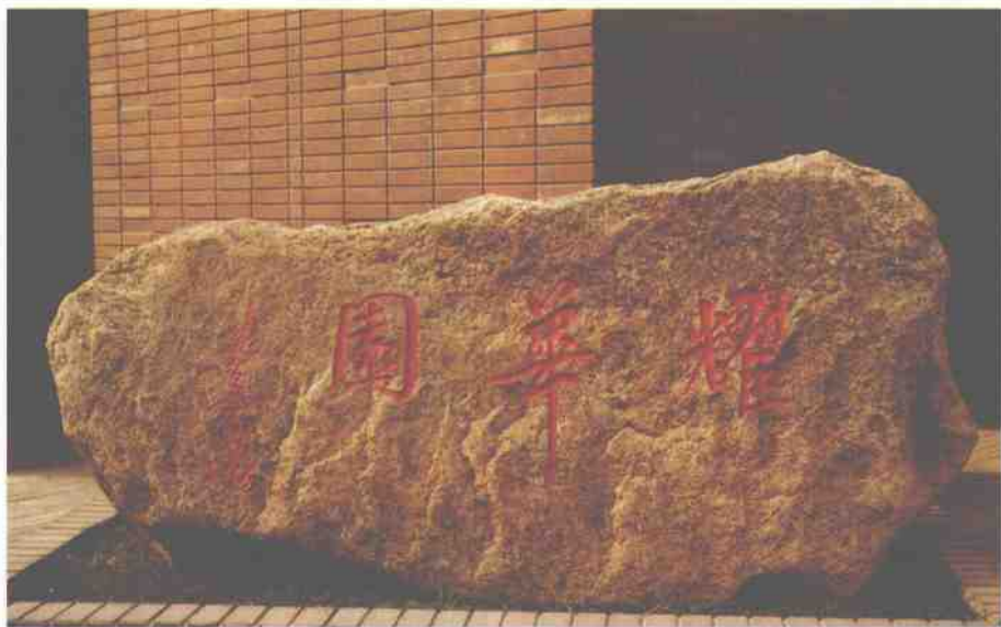
原天津市委书记张立昌题字