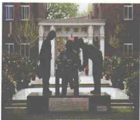
曾执教于耀华的钱伟长院士铜像