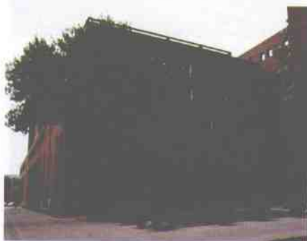
以校训命名的主教学楼