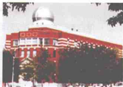
培养创新人才的科技馆