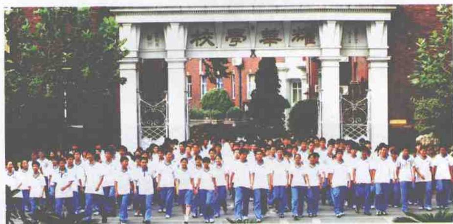
今日耀华学子 明天国家栋梁