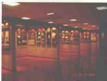
弥足珍贵的校史馆