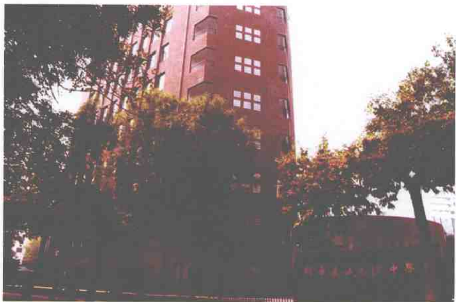
天津市耀华嘉诚国际中学