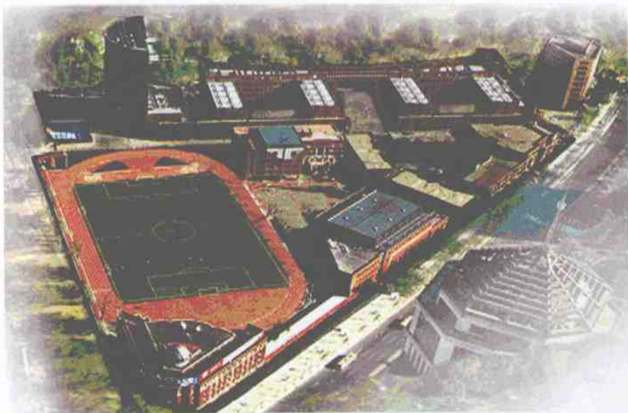
天津市耀华中学全貌