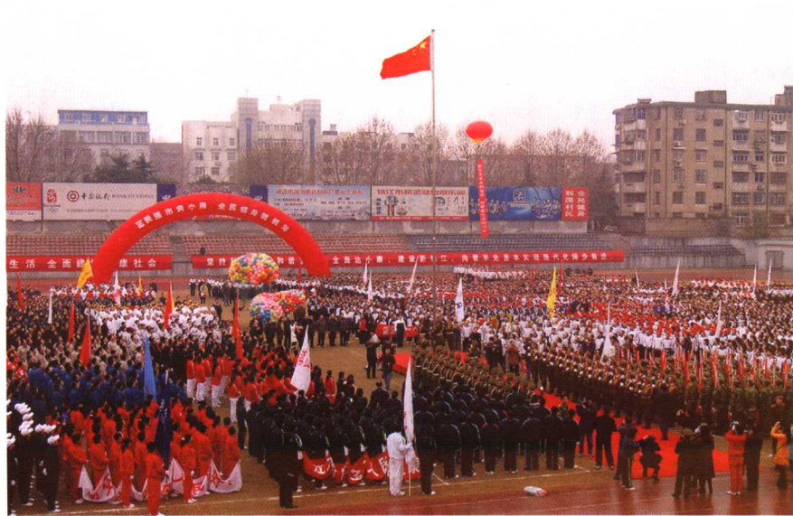
◎2007年1月1日，举办“大港股份杯”2007年镇江市迎新年万人健身长跑活动