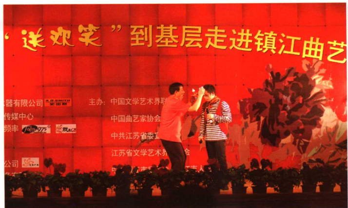
◎2006年9月24日，中国文联、中国曲家协会等举办“送欢笑”到基层走进镇江曲艺晚会