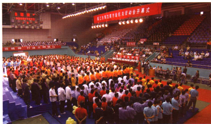
◎2006年9月28日下午，镇江市第四届市级机关运动会开幕式在体育馆举行