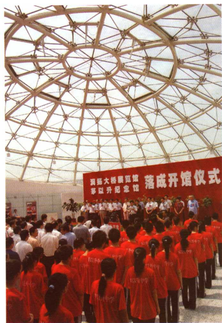
◎2006年8月20日，润扬大桥展览馆、茅以升纪念馆落成开馆