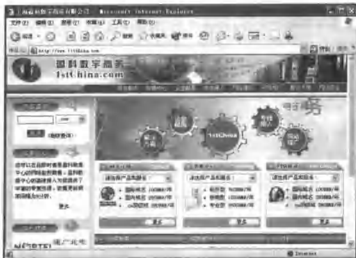
图 1.1 上海盈科数字商务有限公司网站主页

使计算机连接到 Internet,在浏览器中输入上海盈科数字商务有限公司的网址: http://www.1stchina.com ,显示主页如图 1.1 所示。