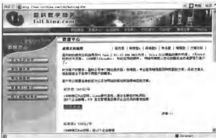
图 1.2 上海盈科数字商务有限公司提供的虚拟主机租用页面

选择“数据中心”的“虚拟主机租用”项目,进入虚拟主机租用页面,如图 1.2 所示,该公司提供的虚拟服务器方式有经济型、标准型、专业型和增强型等方案。