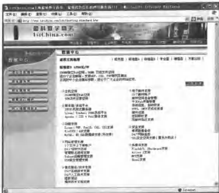
图 1.3 虚拟主机租用标准型 B 方案

上海盈科数字商务有限公司提供的虚拟主机租用标准型 B 方案的服务内容如图 1.3 所示。从中可知一年的费用包括的项目如表 1.3 所示。