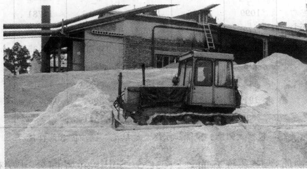
图 1-1 许多国家都有易获得的丰富的生物质资源，但没有得到有效地利用

迄今为止，仍有大量潜在的生物质资源（木材和其他废弃物等）未被开发利用（图 1-1）。亦可通过种植林木和其他能源作物来获取能源。另外，森林是作为碳汇还是替代化石燃料的政策决策，还在辩论之中。树木和其他类型生物质能够作为碳汇，但在其生命周期的终端需作为燃料替代化石能源，或制成经久耐用的木制品 ① 。否则，由于腐烂或就地燃烧，保存在树木中多年的碳将会被完全地释放出来。