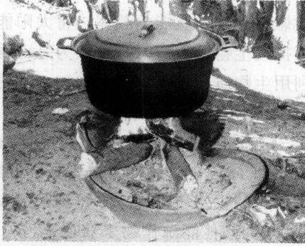
图 1-2 柬埔寨普遍应用的柴炉

但通过表 1-1 可以看出，生物质能在世界上各地的市场份额仍然非常有限。发展中国家大约 35% 的初级能源总量来自生物质能，大部分属于非商业化的传统利用方式（如炊事）（图 1-2）。例如，尼泊尔传统生物质燃料占初级能源供应总量的 90% 以上。而在工业化国家，生物质能仅占初级能源总量的 3%。图 1-3 所示为位于瑞典 Wilderswil 的燃木材区域供热厂布局。