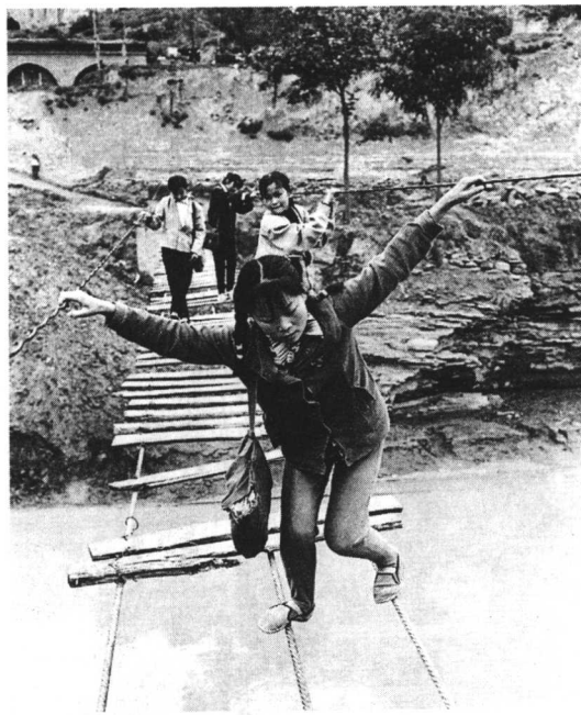
图1-9 上学

新闻摄影以其形象纪实性、可信性成为引导舆论的锐利武器。揭露形形色色违法、违纪、违反社会公德的现象,对消极怠惰、以权谋私、官僚主义以及种种不良行为,进行舆论监督,弘扬社会正气,反映群众的心声,新闻摄影比起抽象的文字表达更能吸引受众的注意力。杨小兵于1996年6月5日拍摄的《上学》(图1-9),读者几乎不用看文字说明,就能从人物形象和反常的环境设施中,领略新闻事实和报道的主题思想:小学生踩着钢丝、如履薄冰上学的险境,实在是当地官僚主义的有力批判。照片在《中国青年报》《陕西日报》先后刊登后,社会反响强烈,陕西省委一位领导当即作出批示,要求迅速整改。三天后,数年解决不了的吊桥缺失的木板终于补齐,小学生上学再也不用提心吊胆了。