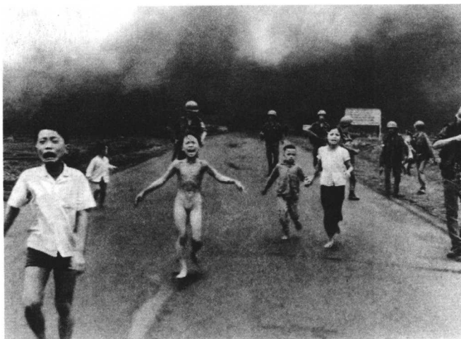
图1-10 逃避美国凝固汽油弹的孩子们

为,有的则是在传播过程中与一定历史条件下的社会氛围、政治斗争氛围相吻合,迸发出特殊的社会效果。《逃避美国凝固汽油弹的孩子们》(图1-10)便是典型一例。