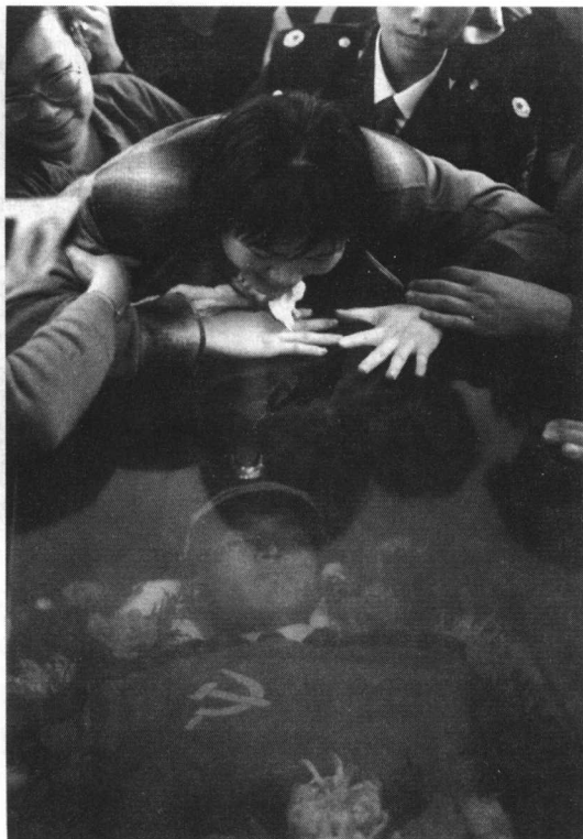
彩图 1-6 新婚诀别