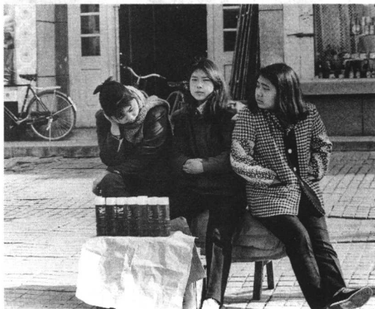
图 1-8 国营小摊

《新婚诀别》(彩图 1-6 见 217 页) 真实生动地记录了新婚仅 45 天的巡警妻子与勇斗歹徒光荣牺牲的丈夫遗体告别的感人场面，悲壮地展示了公安战士的伟大品格和高尚情操。《大学生卖报》(图 1-7) 通过女大学生右手往口袋里塞钱的细节，展现新时期大学生的价值观，无言地批判了轻视劳动的观念，张扬了勤工俭学的好风尚。《国营小摊》(图 1-8)，是 1989 年中国改革开放逐渐深入的时候，媒体上出现的一幅佳作。三个年轻的女售货员，坐在一条板凳上，悠闲地东张西望，等待顾客来买七瓶洗发剂；画面上“三个和尚没水吃”漫画般的意境，真实、典型、生动地反映了某些国有企业人浮于事。作品似乎在说：不对阻碍生产力发展的运转机制进行改革，企业没有出路，中国也没有出路。三幅作品，新闻题材不同，主题不同，但都出色地发挥了宣传教育功能。