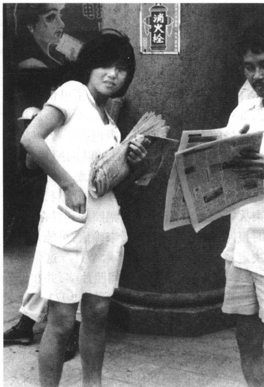
图 1-7 大学生卖报

斗教育等，是新闻摄影责无旁贷的历史使命，也是其他宣传教育形式无法取代的社会功能。