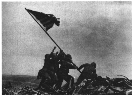
图 1-2 美军占领硫磺岛