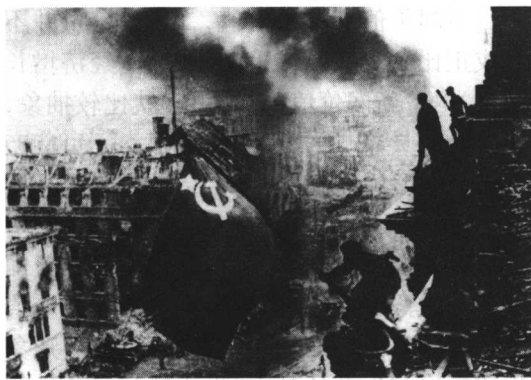
图 1-1 攻克柏林