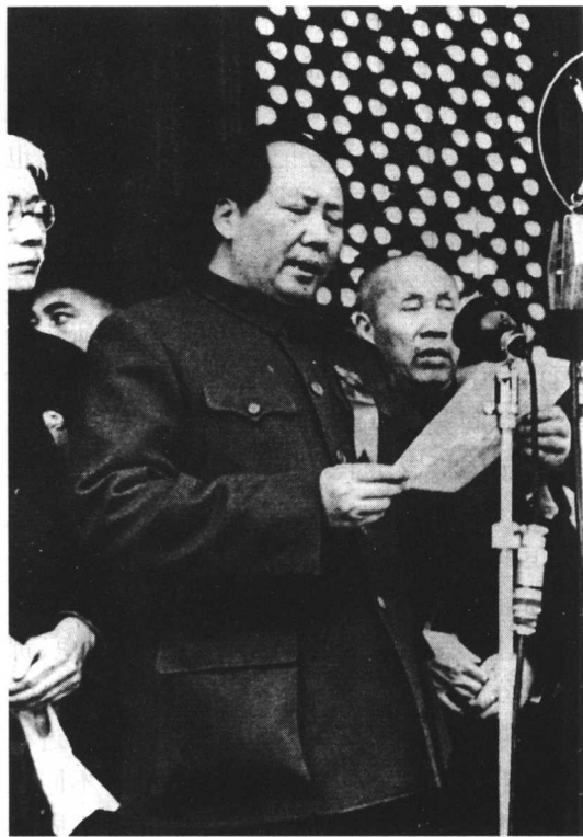
图 1-5 开国大典

几千年来主要依靠抽象的文字记载。摄影术的发明,新闻摄影的问世,人们了解历史、瞻仰历史、研究历史,有了纪实的、可视的形象史料。如果说今天的新闻,便是明天的历史;换句话说,昨天的新闻照片,便是今天回顾历史的形象史料。反映第二次世界大战的《攻克柏林》(图 1-1)、《美军占领硫磺岛》(图 1-2),记录中国历史伟大变革的《占领南京伪总统府》(图 1-3)、《斗争恶霸地主》(图 1-4)、《开国大典》(图 1-5)等,都是新闻摄影记录历史的经典之作。它们形象地记录了人类社会正义战胜邪恶,进步必然替代腐朽的历史。