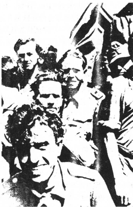
站在埃菲尔铁塔上的德国士兵

同组织重大的行动。现在则成为诺曼底登陆中战略欺骗的组织机构。该处的格言是机智、狡猾和精致，徽章是半人半羊的农牧神萨图恩的雕像，萨图恩是古罗马神话中专门兴风作浪的小精灵。时任处长的是英国陆军中校约翰·比万，他的绰号是诈骗总管。虽然他职务和军衔不高，却拥有很大权限，甚至有时丘吉尔、罗斯福都要遵照他的要求安排活动或发表声明。