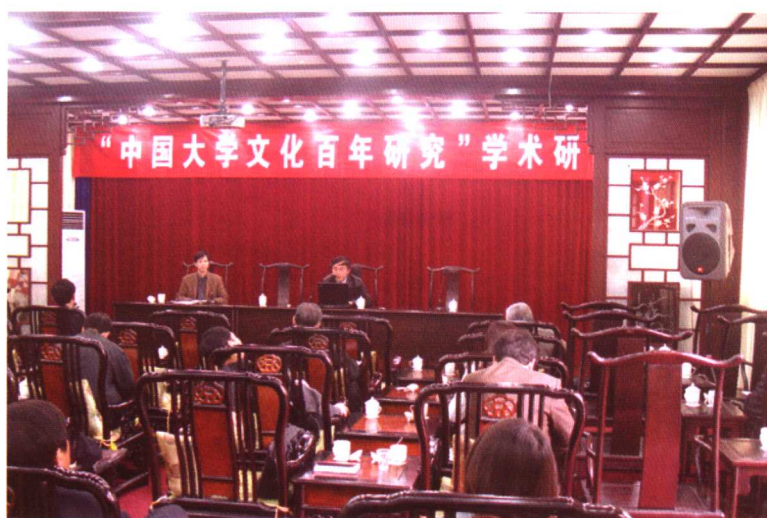
“中国大学文化百年研究”学术研讨会在我校召开