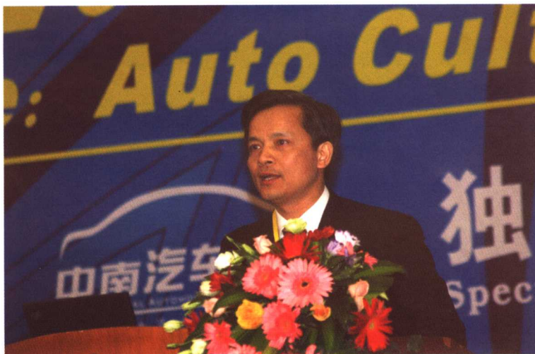
钟志华教授当选中国工程院院士