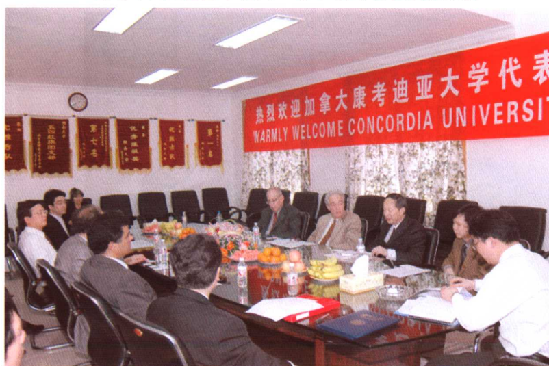
加拿大康考迪亚大学代表访问我校