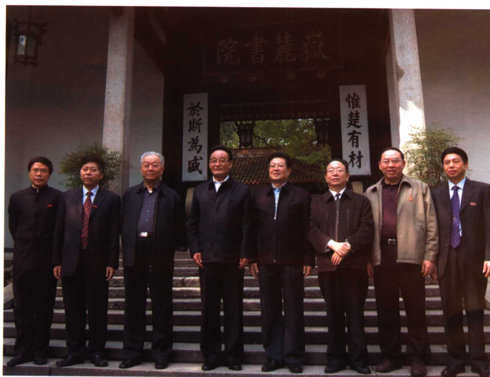
中共中央政治局常委吴邦国委员长视察我校