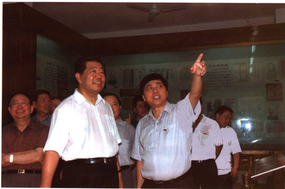
中共中央政治局常委、全国政协主席贾庆林同志来我校视察