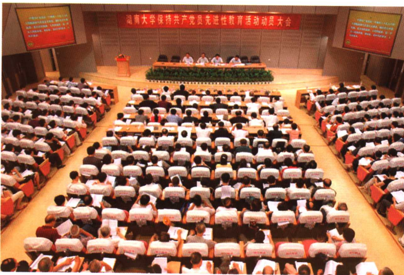
保持共产党员先进性教育活动动员大会