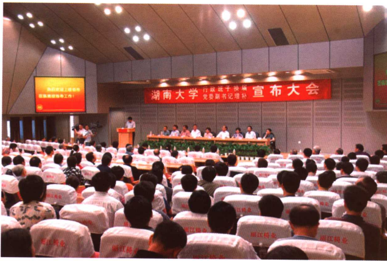
教育部副部长吴启迪来校宣布学校行政班子换届决定