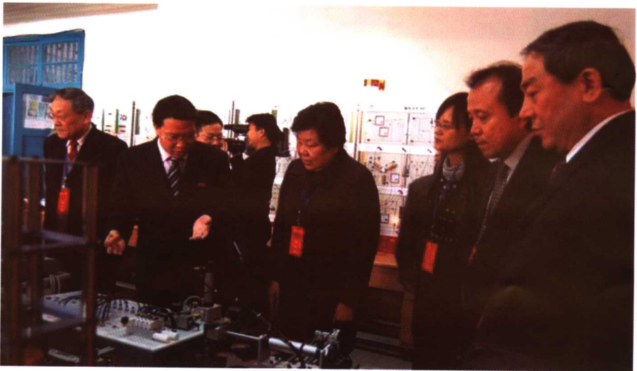
教育部本科教学工作评估专家组考察实验基地