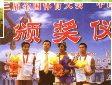
东亚攀岩队勇夺三体会2枚金牌