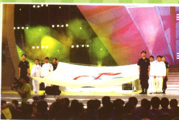
特奥会上海赛开幕式