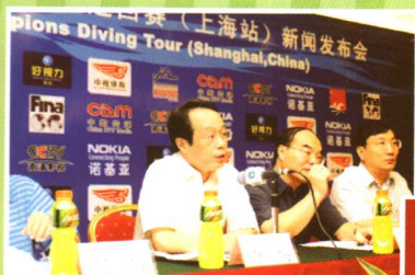
2006国际跳水冠军巡回赛（上海站）新闻发布会

上海东亚体育文化中心真诚期望有更多的中外体育、演艺界经纪人了解我们；有更多的合作者选择我们；让更多的观众走近我们。