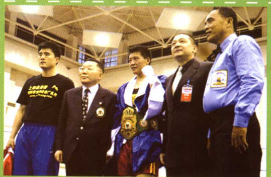
中国WBA . PABA国际职业拳击拳王争霸赛