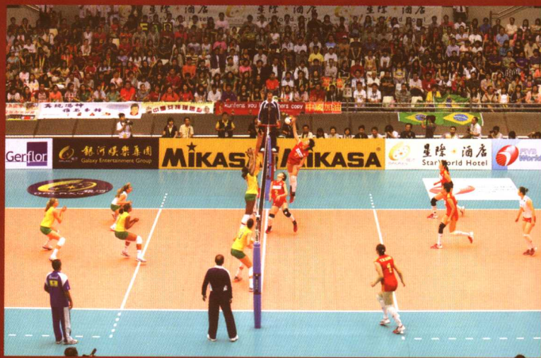
澳门世界女子排球大奖赛