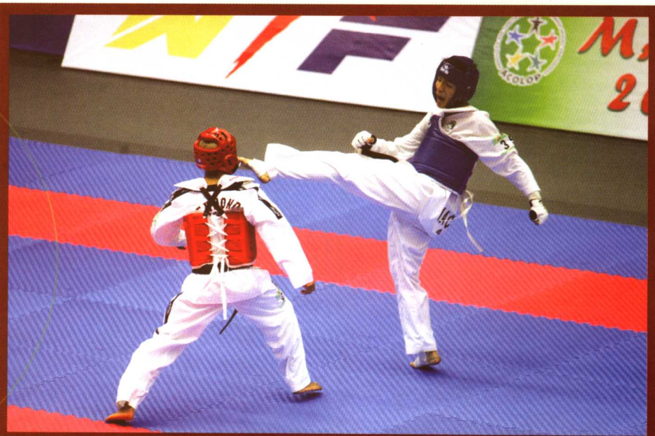
第一届葡语系运动会—澳门第一面银牌

同时，第一届葡语系运动会的圆满举办，证明了澳门政府的组织能力，显示出社会各界的积极支持及配合。澳门运动员表现出色，摘下三银十一铜的优异成绩，整个葡语地区以至世界其它国家地区的人们都将目光投向了澳门，见证了澳门的出色表现。