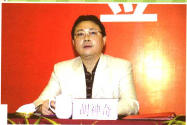
第十一届全运会上海男子足球队举行组建签约