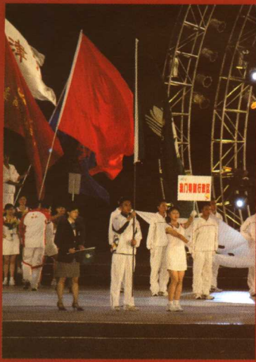
第三届全国体育大会