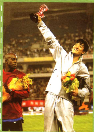
上海国际田径黄金大奖赛刘翔夺冠