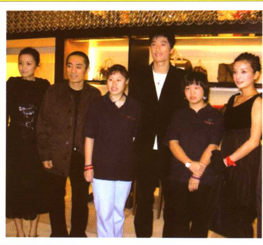
奥运金牌得主刘翔、著名导演张艺谋及著名影星徐静蕾、赵薇与特奥运动员合照

自尤妮斯·肯尼迪·施莱佛女士于1968年在美国成立特奥会以来，不断地为全球最大的残障群体——智障人士提供机会。特奥运动致力于通过体育训练和竞赛，促进智障人士身体健康，使他们成为有用的、受到尊敬的社会成员。目前全球在150多个国家和地区约有200余万名特奥运动员。特奥会东亚区共有超过58万名运动员。