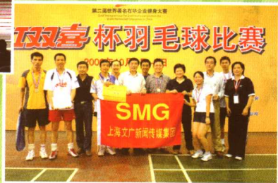
“金施尔康杯”第二届世界著名在华企业健身大赛“红双喜”杯羽毛球赛