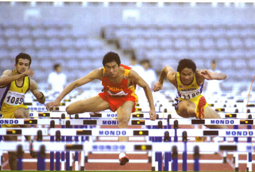
第十二届亚洲青年田径锦标赛

除了举办大众体育活动外，每年亦会举办多项大型赛事，2006年举办了澳门国际柔道邀请赛、澳门高尔夫球公开赛、第十二届亚洲青年田径锦标赛、澳门国际马拉松、澳门羽毛球公开赛、动感亚洲越野挑战赛、澳门世界女子排球大奖赛、第七届亚洲龙舟锦标赛、亚太区体育舞蹈锦标赛、澳门国际格兰披治小型赛车锦标赛、澳门国际铁人三项赛暨亚洲杯分站赛、环南中国海自行车赛等。