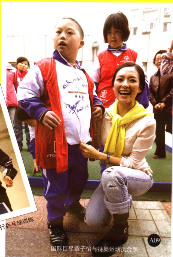
国际巨星章子怡与特奥运动员合照