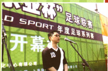
东亚杯足球赛开幕式