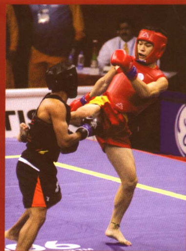
第十五届多哈亚洲运动会

同时，第一届葡语系运动会的圆满举办，证明了澳门政府的组织能力，显示出社会各界的积极支持及配合。澳门运动员表现出色，摘下三银十一铜的优异成绩，整个葡语地区以至世界其它国家地区的人们都将目光投向了澳门，见证了澳门的出色表现。