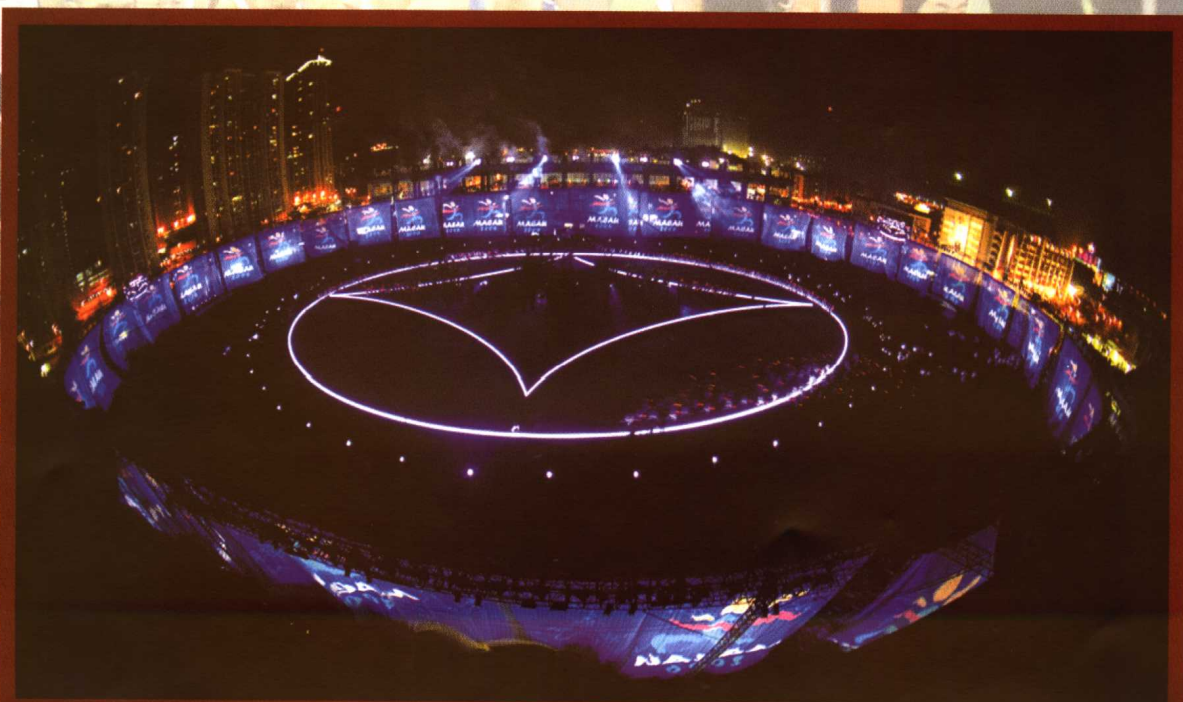
第一届葡语系运动会—开幕式