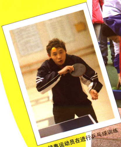
特奥运动员在进行乒乓球训练

2007年的特奥夏季世界运动会将于2007年10月在中国上海举行。这次盛会将首次在亚洲举行，第二次在美国以外的地方举行。运动员人数将达7,000人，同时还将吸引4万名志愿者，3,500名裁判和数千名家属成员以及来自世界各大洲的志愿者、观众和记者前来参加。