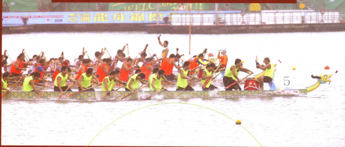
第七届亚洲龙舟锦标赛

与此同时，出外参加体育竞赛的队伍亦不断增加，如组队参加国际单项体育联合会所举办的国际性赛事和综合运动会，2006年参加了第三届全国体育大会、国际儿童运动会及第十五届多哈亚洲运动会等，使澳门运动员有更多机会接触国际赛事，向世界宣传澳门的体育事业，提升澳门的国际形象。