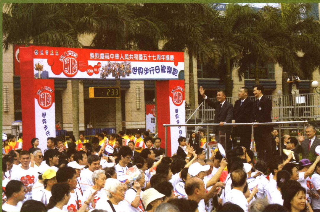
“澳人齐贺国庆” 世界步行日欢乐跑

澳门特别行政区政府体育发展局是澳门特别行政区政府社会文化司下属机构，具有行政自治权的局级公共部门，专责执行特区政府的体育政策。并对全澳体育单项总会在组织参赛、培训等活动等方面给予财政、医疗及场地等资源上的辅助，促进澳门体育运动整体的发展。