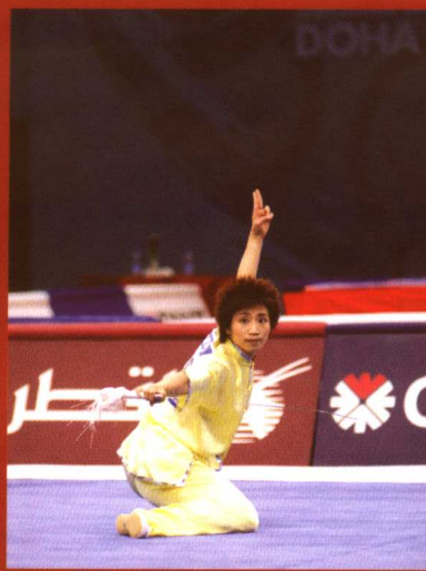
第十五届多哈亚洲运动会