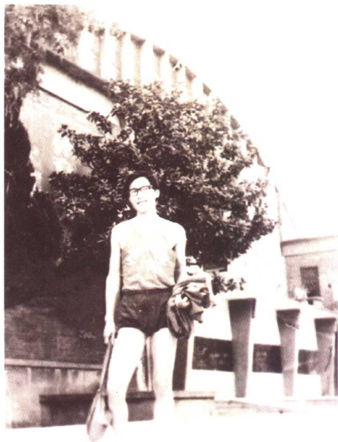
意气风发的大学生时代（1980年）