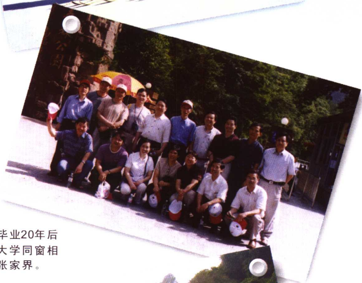
毕业20年后 部分大学同窗相 聚于张家界。