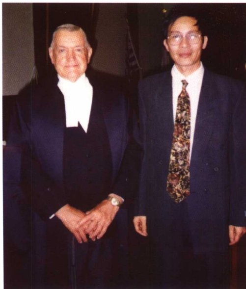
1993年6月，刘桂宽律师访问加拿大哥伦比亚省上诉法院时与该院首席大法官麦克春合影。