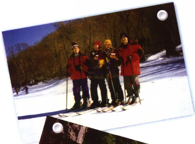
与朋友们在 黑龙江亚布里滑 雪（1998）。