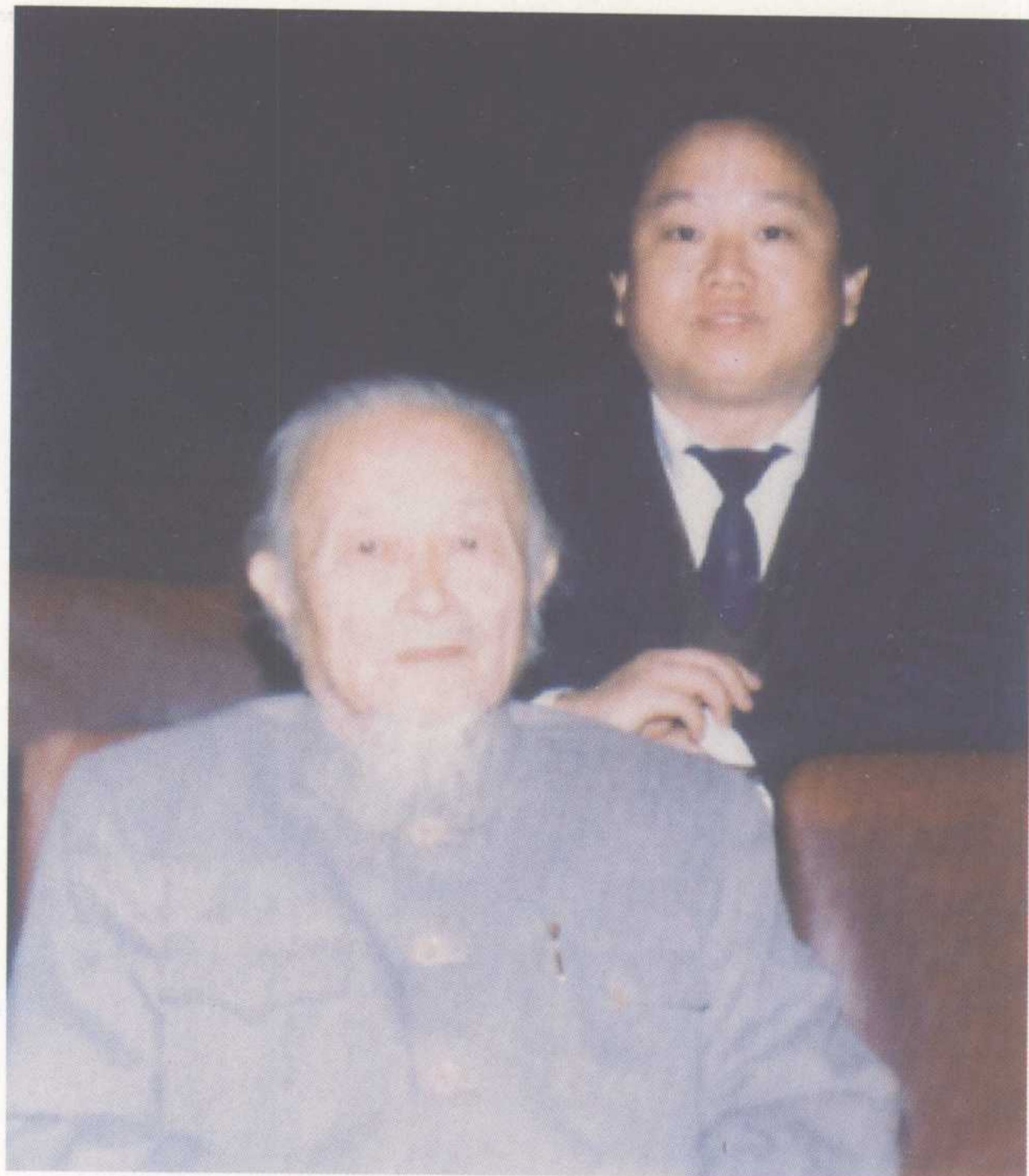
作者與戲劇家阿甲合影