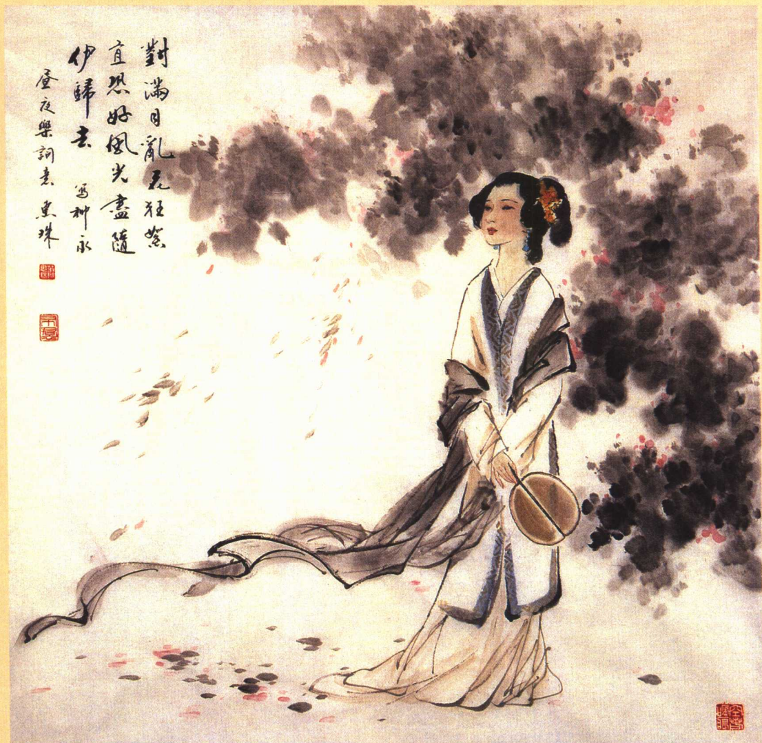
昼夜乐（洞房记得初相遇） 词意图 萧惠珠 绘